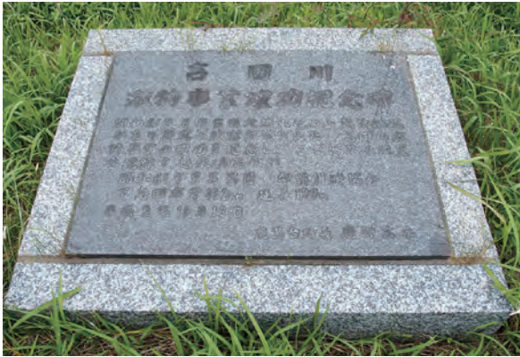
吉田川激特事業成功記念碑(鹿島台町)

して、人を鍛えてくれている、教えてくれるところもあると思います。今後の治水事業を、陰ながら応援したいと思っています。