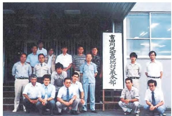
吉田川災害現地対策本部を設置、懸命な復旧活動を実施。