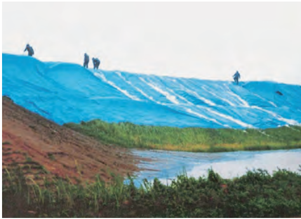
シート張りなど懸命な水防活動を行ったが、堤防を越水し、その後4カ所で決壊。