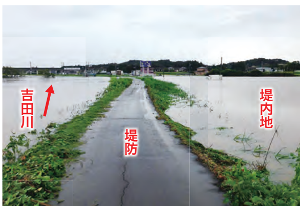
H27年9月豪雨の越水の様子（大和町鶴巣大平地内）

鹿野 当時、日中は災害対策、夜は避難所をまわり、また地域の一軒一軒をお見舞いして回りました。「大丈夫ですか」と声を掛けると、住民から「町長こそがおるなよ（疲れるなよ）」と返ってきた。災害は大変な経験ですが、人の痛みを理解できる人と