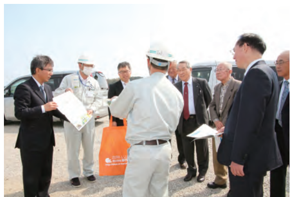
現場視察（吉田川左岸堤防上）