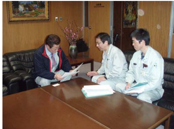
市長への説明状況 (3/29)