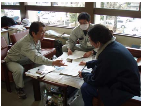
排水ポンプ設置箇所打合せ (3/30)