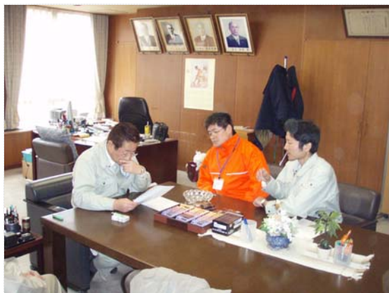
市長への報告状況（3/23）