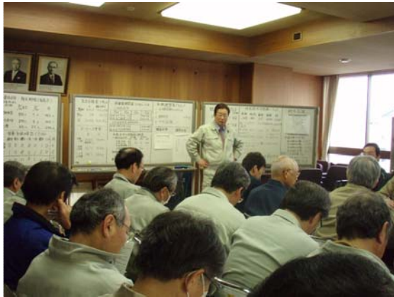
災害対策本部定例会議 (3/29)