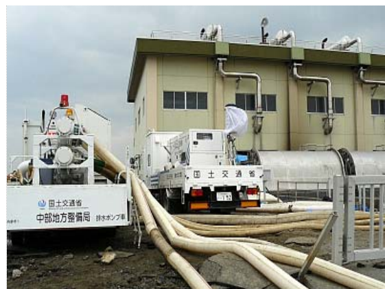
排水ポンプ車稼働状況 (4/11)