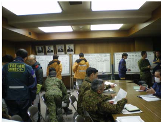
災害対策本部の様子（3/26）