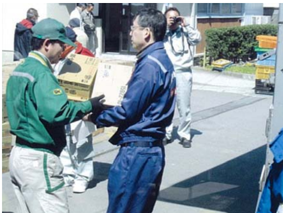
救援物資荷下ろし状況 (3/23)