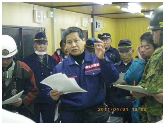
合同会議出席状況 (4/1)