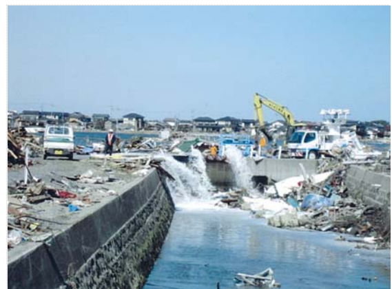
荒浜地区排水状況 (3/24)