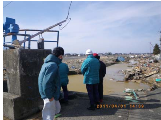
浸水箇所現地調査状況 (4/1)