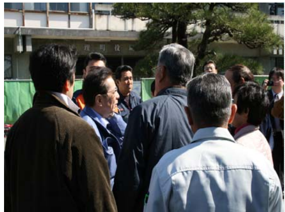
仙石官房副長官・辻元総理補佐官 現地視察（4/24）