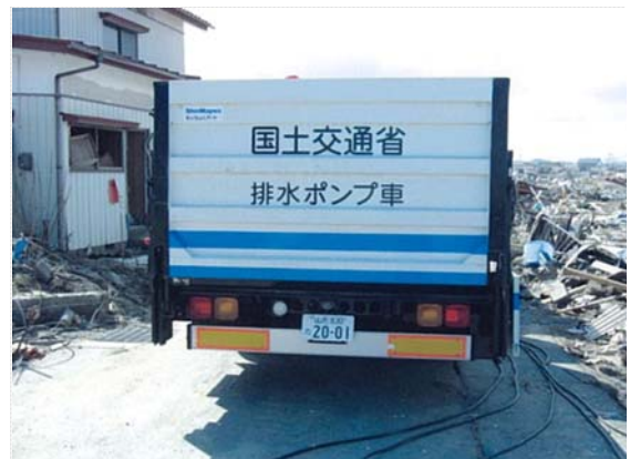
新庄河川事務所排水ポンプ車 (3/24)