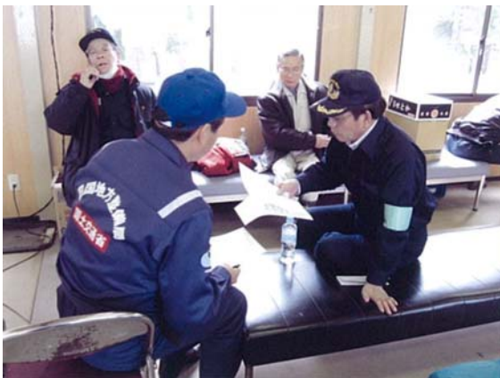
町長との打合せ状況 (3/23)