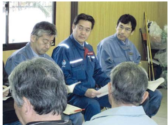
総務省・国交省政務官現地視察 (3/24)