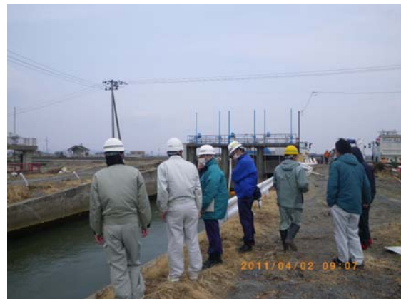
排水ポンプ車配置位置検討 (4/2)