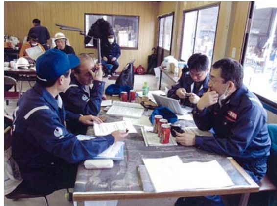
リエゾン活動状況 (3/23)