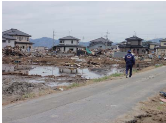
浸水箇所現地調査状況 (4/18)