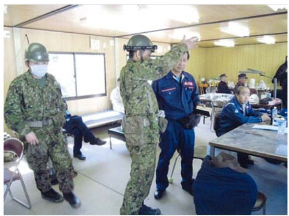
自衛隊との打合せ状況 (3/23)