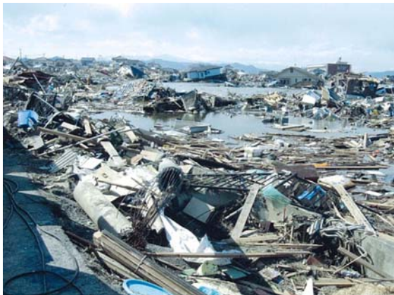
荒浜地区被災状況 (3/24)