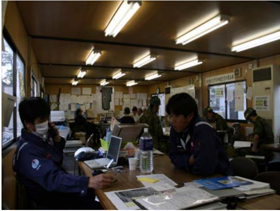
リエゾン活動状況（4/22）