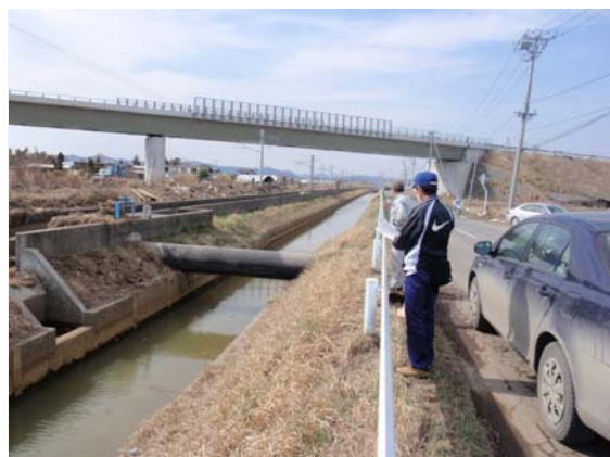
改良区水路状況確認状況 (4/18)