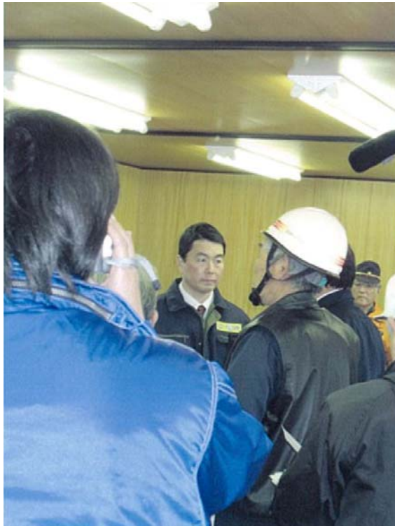
村井県知事現地視察 (3/23)