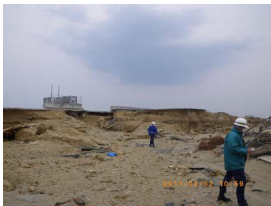
防波堤被災状況確認 (4/2)