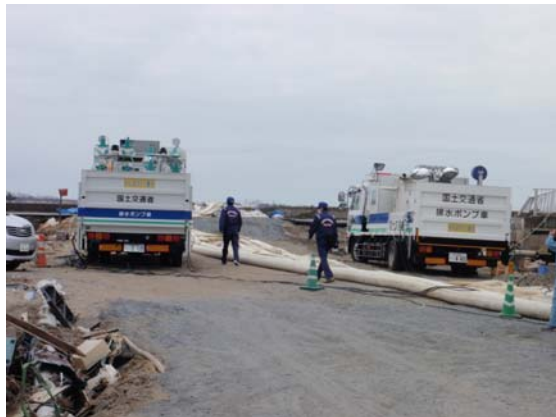
排水ポンプ車稼動確認状況 (4/18)