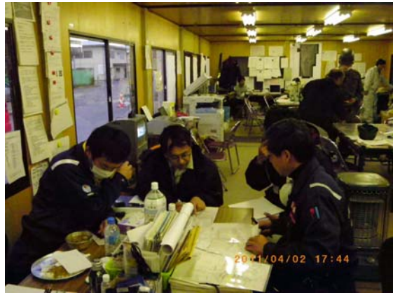
海水流入箇所仮締め切り検討 (4/2)