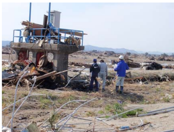
改良区水路現地確認状況 (4/18)