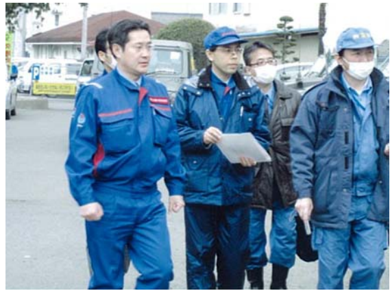
国交省政務官現地視察 (3/24)