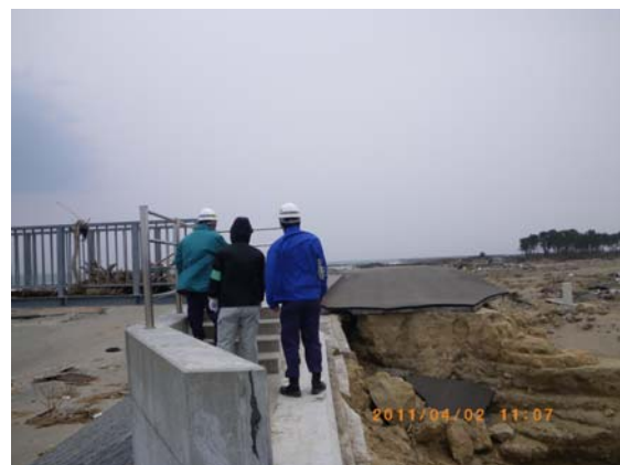
防波堤被災状況確認 (4/2)