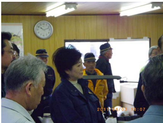
小池百合子議員来訪 (4/3)