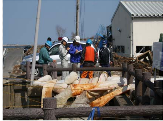
排水作業現場打合せ状況（4/22）