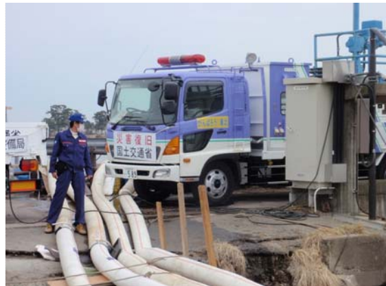
排水ポンプ車稼動確認状況 (4/18)