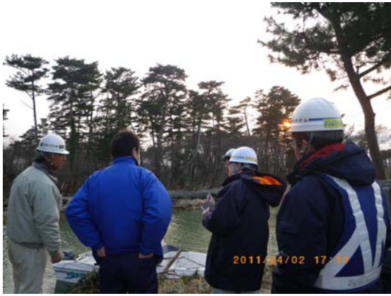
海水流入箇所現地調査 (4/2)