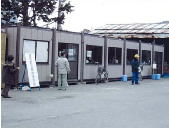
仮設災害対策本部 (3/23)