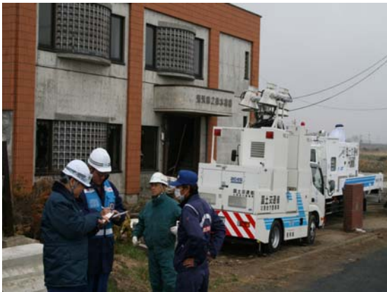
排水作業現場打合せ状況（4/23）