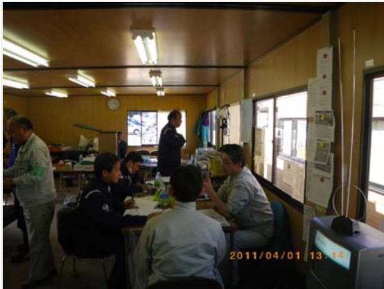
町との排水計画検討状況 (4/1)