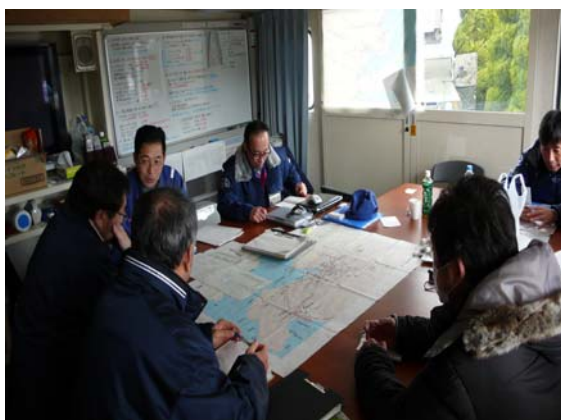
仮庁舎打合せ (国交省・大槌町・土工協) (3/27)