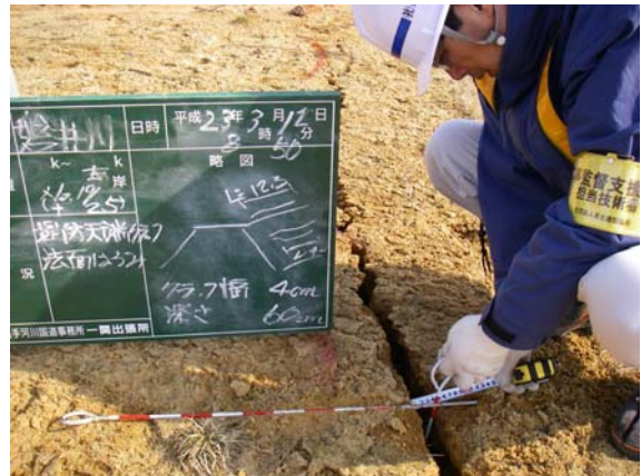
第1遊水地小堤巡視（管理堤クラック）①