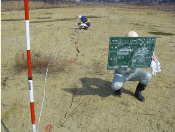
第1遊水地小堤巡視（小堤盛土）③