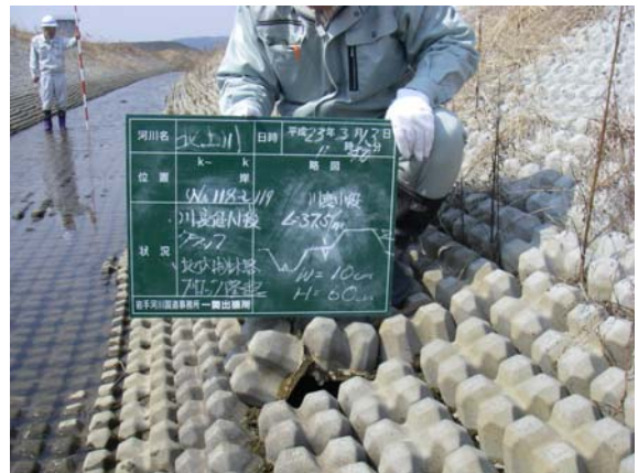
第1遊水地地内排水路巡視（法面欠落）③