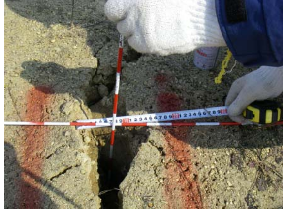
第1遊水地小堤巡視（管理堤クラック）③