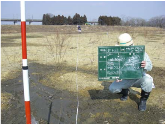
第1遊水地小堤巡視（小堤盛土）② 旧川箇所