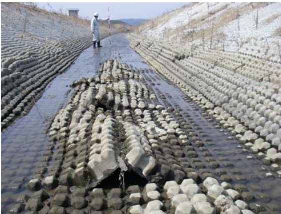
第1遊水地地内排水路巡視（底版凹凸）③