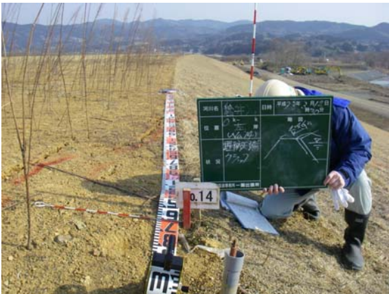
第1遊水地小堤巡視（管理堤）①