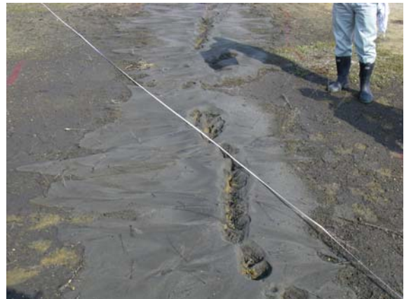
第1遊水地小堤巡視（小堤盛土液状化）②