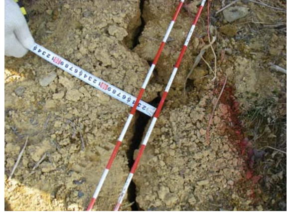
第1遊水地小堤巡視（管理堤クラック）①