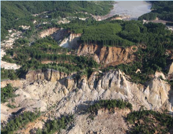
▲荒砥沢ダム上流 宮城県栗原市