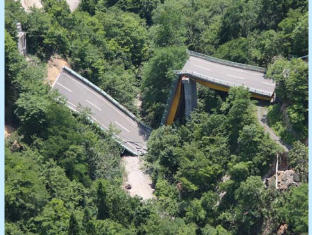
▲国道342号 岩手県一関市