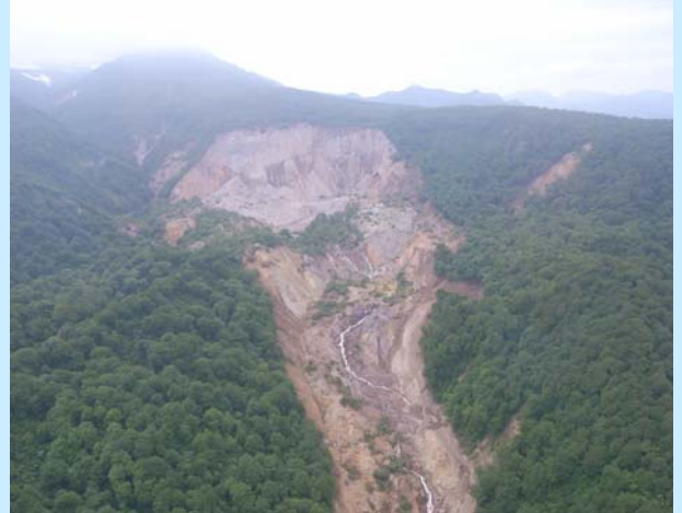
▲駒の湯温泉上流部 宮城県栗原市