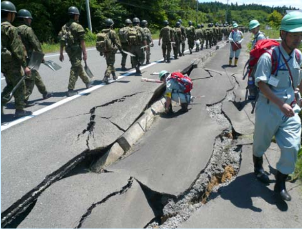
▲国道398号 宮城県栗原市