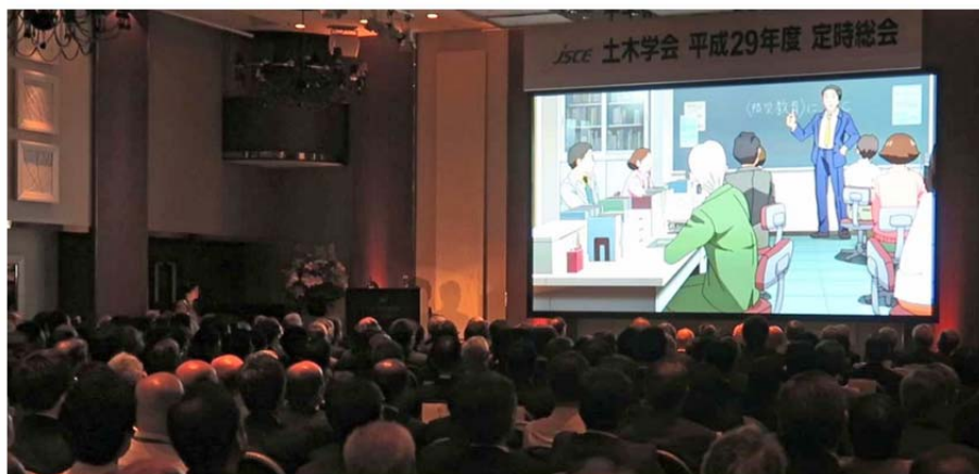
表彰式における作品紹介（その②）