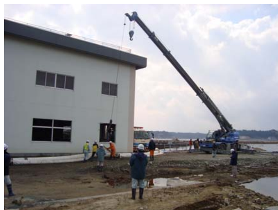
排水ポンプ設置箇所ヤード造成 ポンプ車設置立会い状況 (3/31)