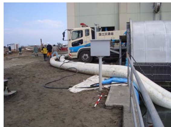
排水ポンプ設置箇所ヤード造成 ポンプ車設置立会い状況 (3/31)