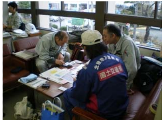
相馬市との排水打合せ (4/9)