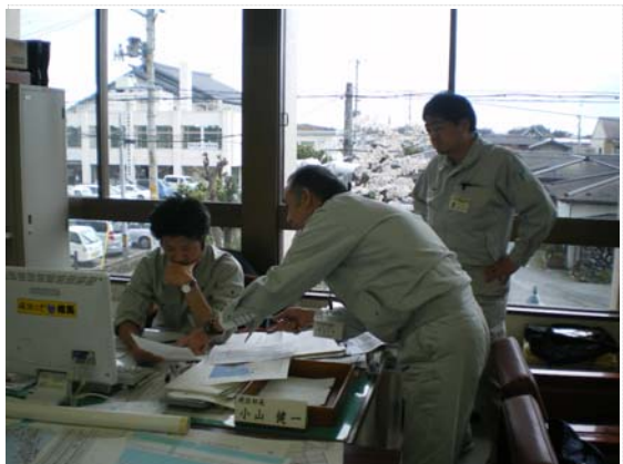
リエゾン活動状況 (4/20)