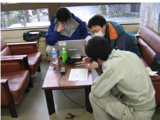
相馬市との排水打合せ (4/22)