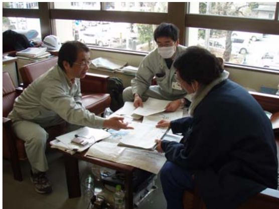
排水ポンプ設置箇所打合せ (3/30)