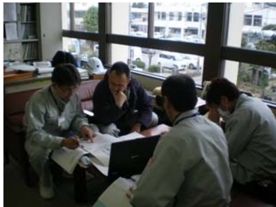
東北地整との排水打合せ (4/8)