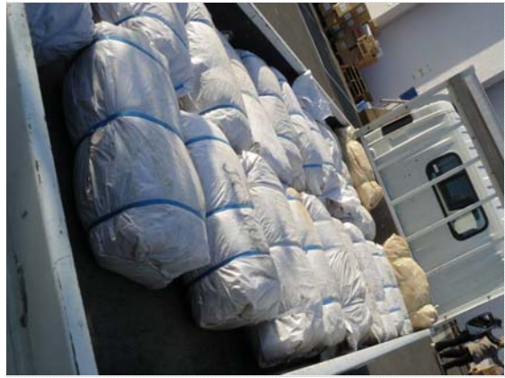
大型土のう搬入状況 (4/16)