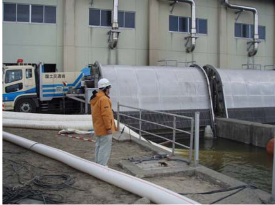
排水ポンプ稼働状況確認 (4/4)