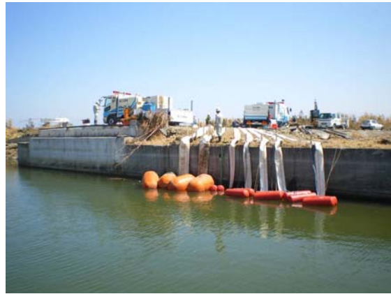
排水ポンプ設置立会い (4/1)