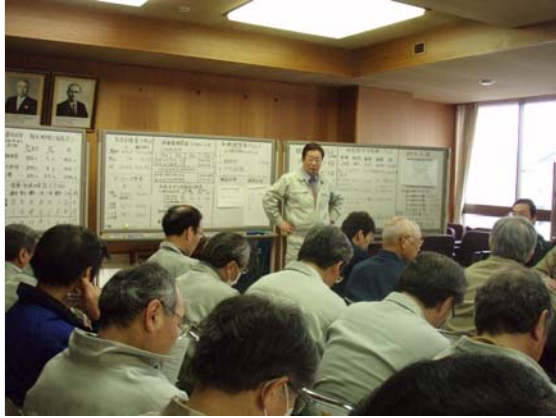
災害対策本部定例会議 (3/29)