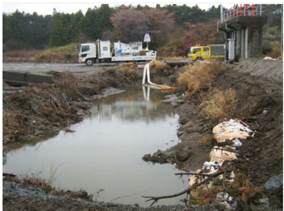
排水ポンプ車稼働状況 (4/23)