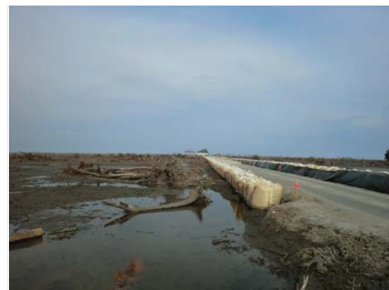
新田地区仮設道路施工状況（5/9）