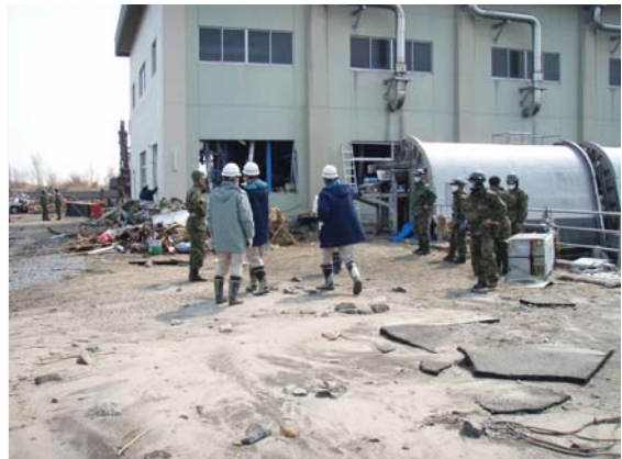
排水ポンプ設置箇所現地確認 (3/30)