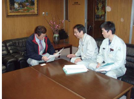
市長への説明状況 (3/29)