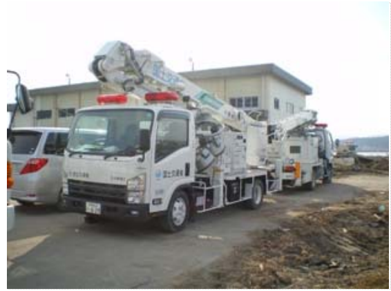
中部地整災害支援車両 (4/7)