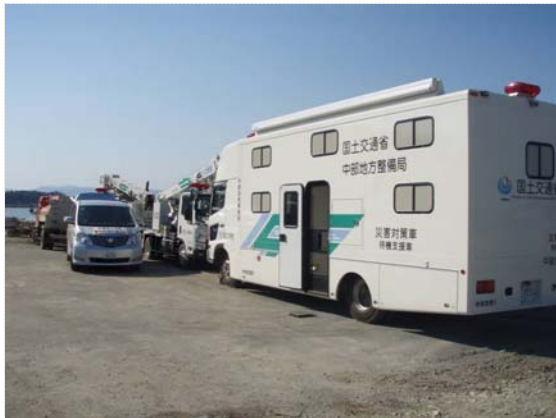
新規待機支援車配置確認 (4/5)