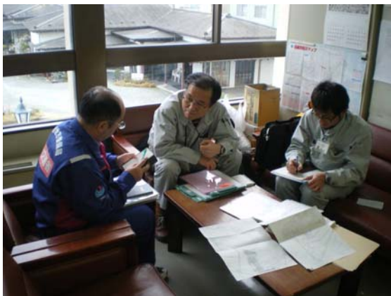
リエゾン活動状況 (4/3)