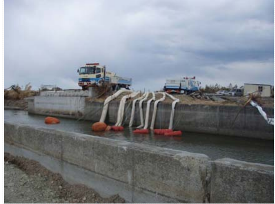
排水ポンプ稼働状況 (4/4)