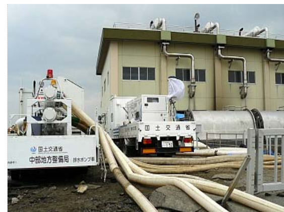
排水ポンプ車稼働状況 (4/11)