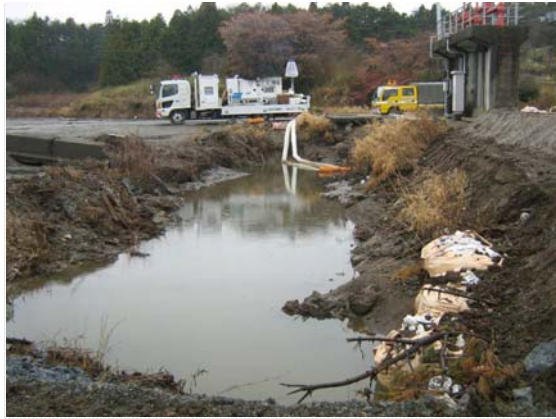
排水ポンプ車稼働状況（4/28）