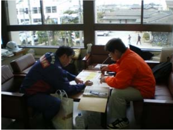
相馬市との打合せ (4/7)