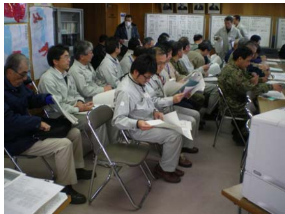
リエゾン活動状況 (4/3)