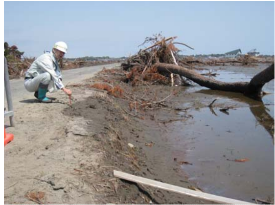
市との現地確認状況（5/4）