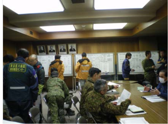
災害対策本部の様子（3/26）