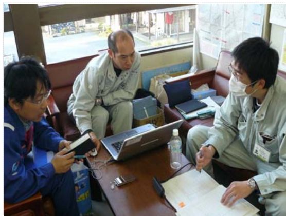
TEC-FORCE との打合せ状況 (4/16)