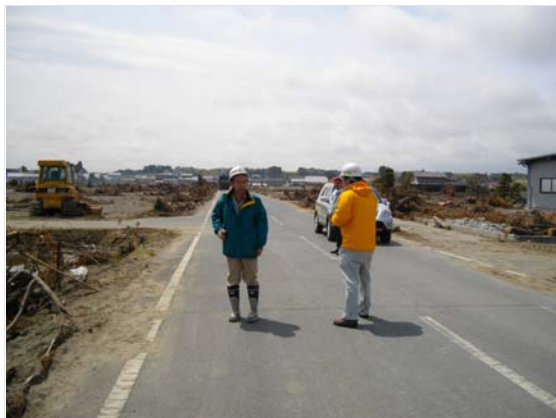
県との現地打合せ状況（5/5）