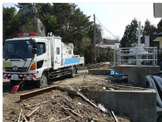
排水ポンプ車稼働状況 (4/10)