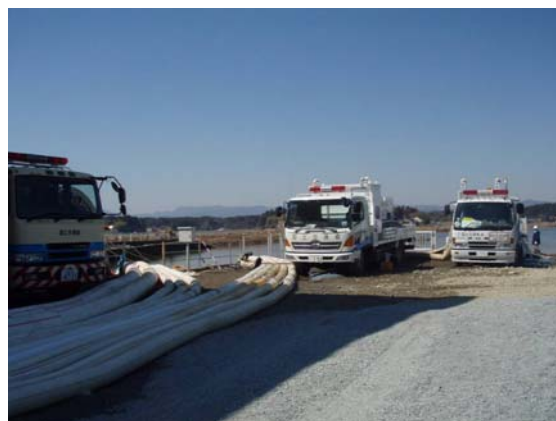
排水ポンプ稼働状況確認 (4/6)