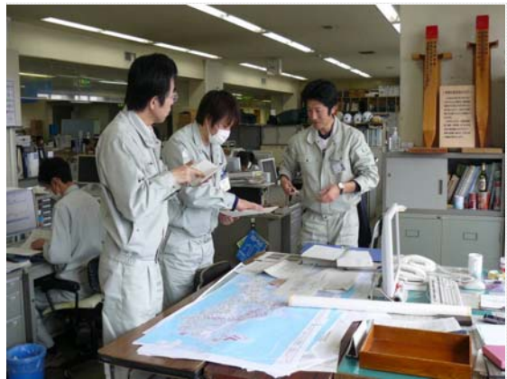
相馬市との排水打合せ (4/18)