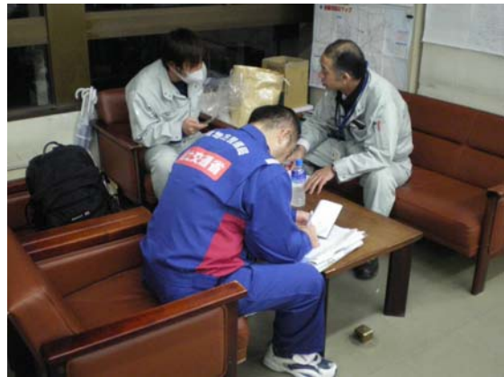
リエゾン活動状況 (4/2)