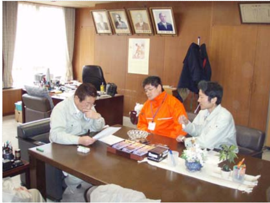
市長への報告状況（3/23）