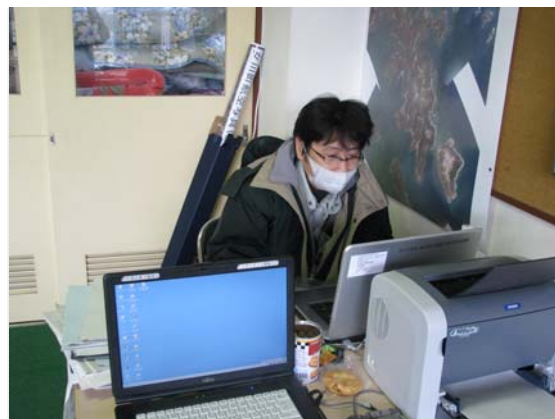
リエゾン活動状況 (4/2)