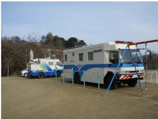
災対本部車・衛星通信車 (4/7)