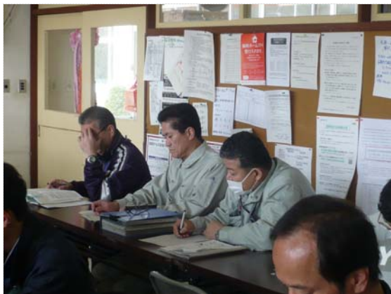
災害対策本部会議 (4/30)