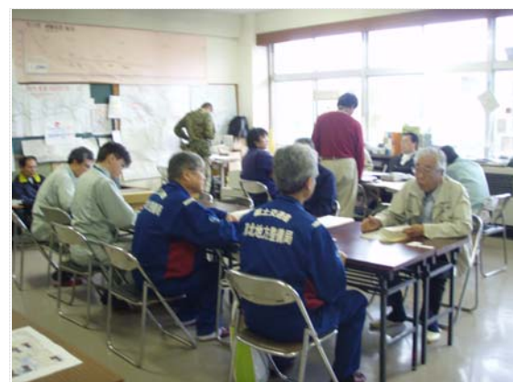
東北地方整備局・建設部長と町長対談 復旧・復興計画について (5/30)