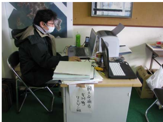
リエゾン活動状況 (4/2)