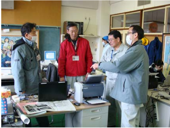
リエゾン引き継ぎ状況 (3/26)