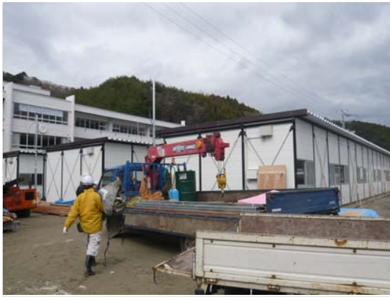
仮設住宅建設状況確認 (4/20)