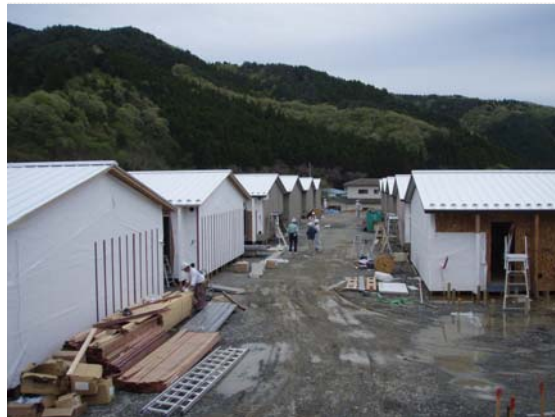
仮設住宅建設進捗状況確認 (5/10)