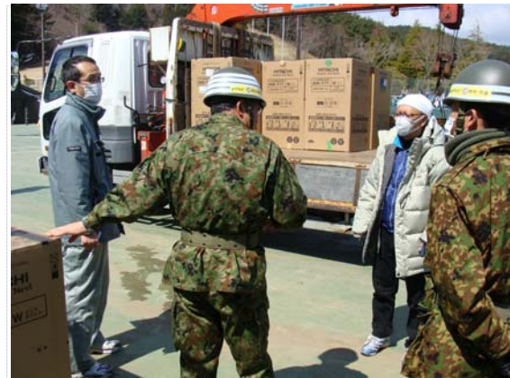
リエゾン活動状況 (3/28)