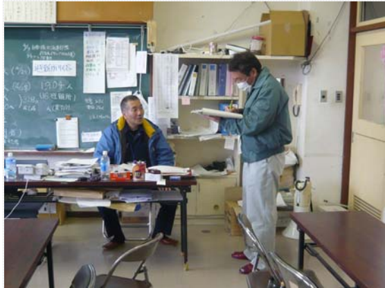
リエゾン打合せ状況 (4/26)