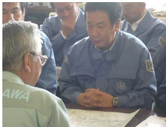
枝野官房長官現地視察 (5/5)