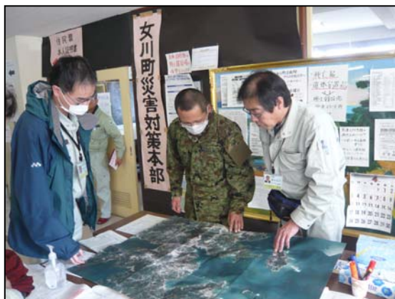
自衛隊との打合せ状況 (4/11)