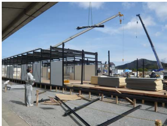
仮設住宅建設進捗状況確認 (5/2)