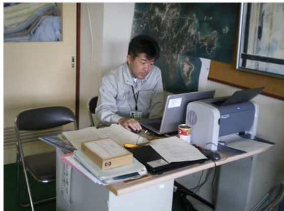
リエゾン活動状況 (4/10)