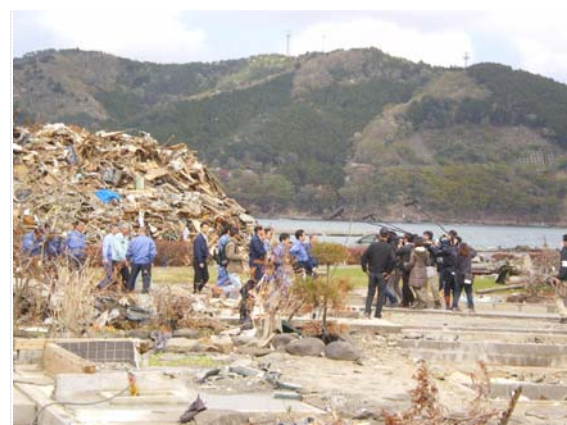
枝野官房長官現地視察 (5/5)