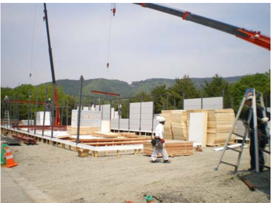
仮設住宅建設進捗状況確認 (5/17)