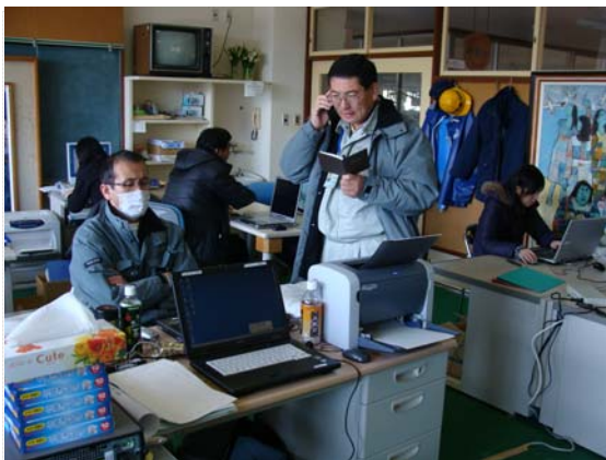
リエゾン活動状況 (3/27)