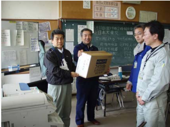
支援物資受渡し状況 (4/4)