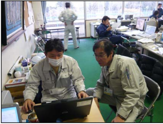
リエゾン及び支援活動状況 (4/14)