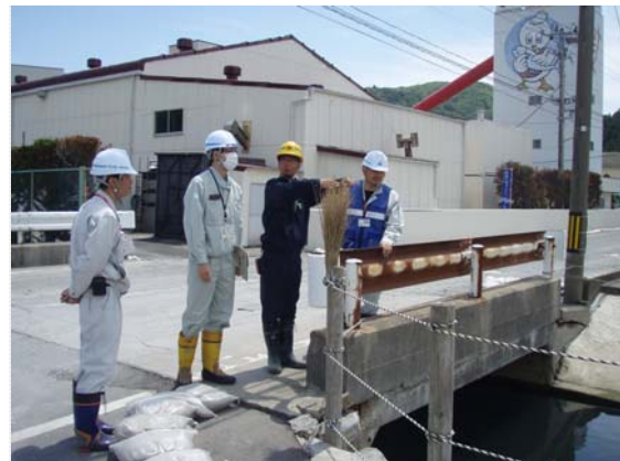
女川町との現地打合せ状況 (5/26)