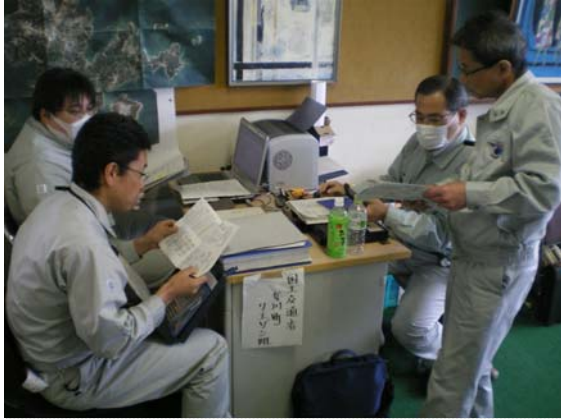
リエゾン引継ぎ状況 (5/22)