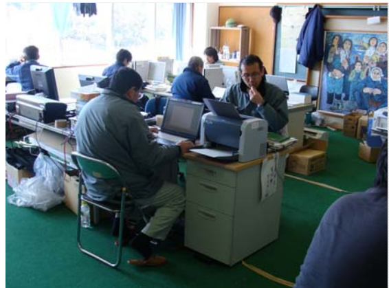
リエゾン活動状況 (3/27)