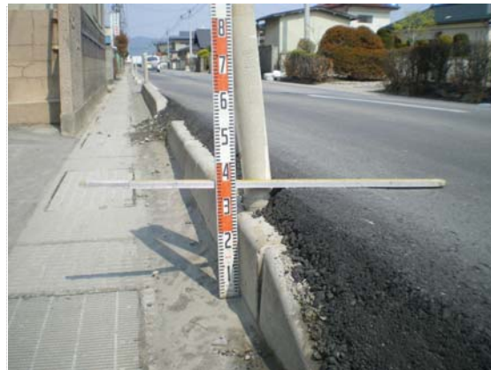
R398 嵩上げ状況 (5/17)