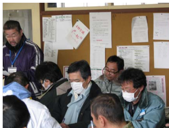
リエゾン会議出席状況 (4/3)