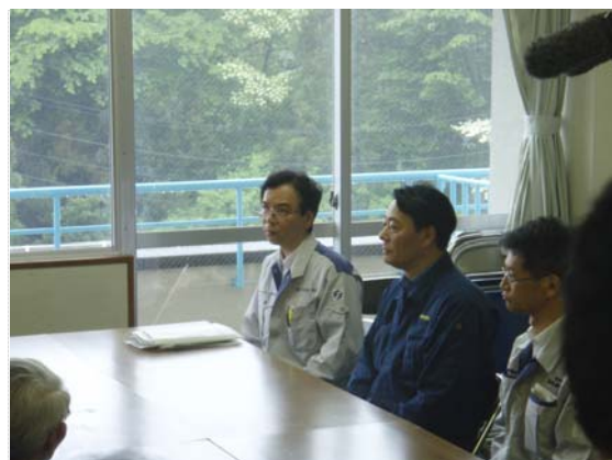
経済産業省・海江田大臣現地視察 (5/28)