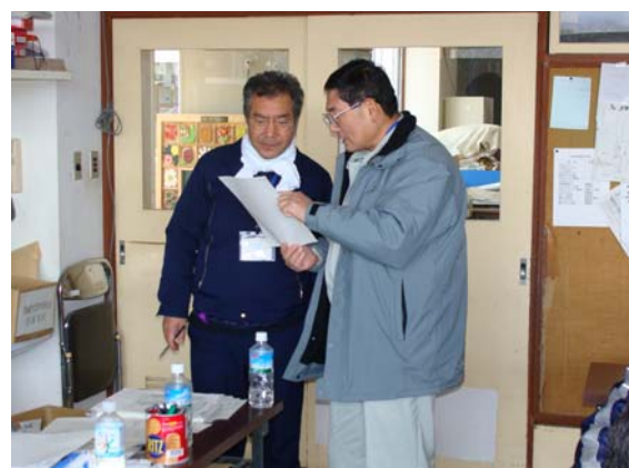
リエゾン活動状況 (3/27)