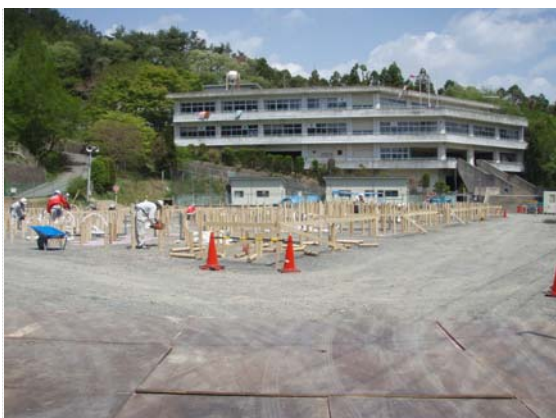
仮設住宅建設進捗状況確認 (5/14)