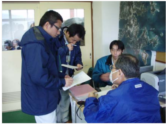
リエゾン引継ぎ状況 (4/19)