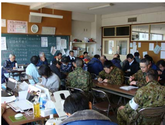
災害対策本部会議状況 (3/27)