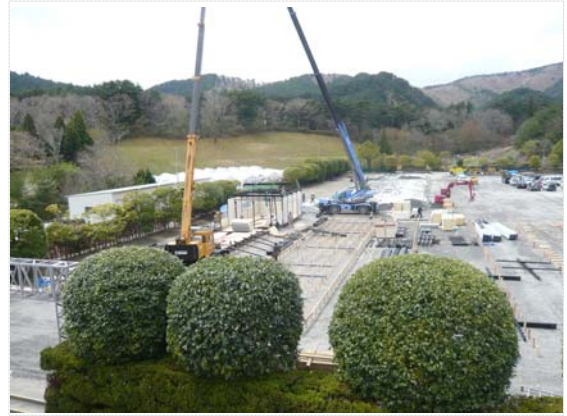
仮設住宅建設進捗状況確認 (4/29)