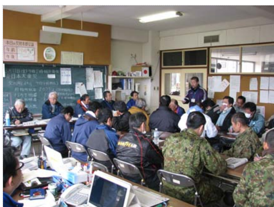
災害対策本部会議状況 (4/3)