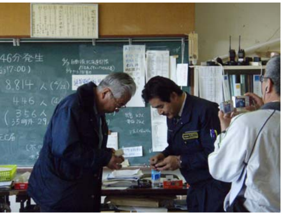
佐藤正久議員来所 (4/24)