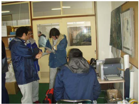
リエゾン引継ぎ状況 (4/22)