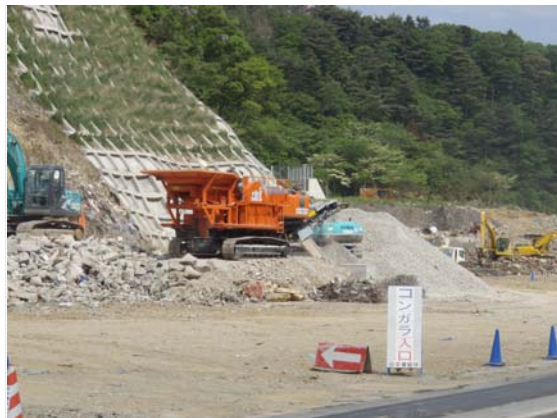
骨材再生状況確認 (5/25)