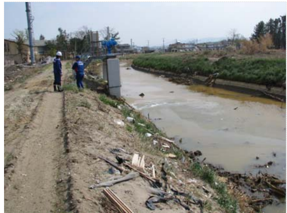
花笠排水ゲート水位状況確認 (5/8)