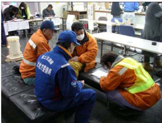
路面清掃業者との打合せ状況 (4/2)