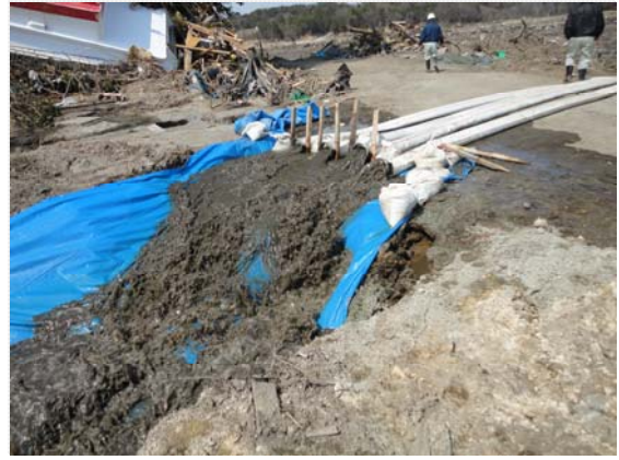
ポンプ車による排水状況 (3/29)