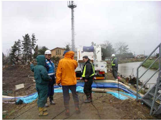
排水班との現地打合せ状況 (4/19)