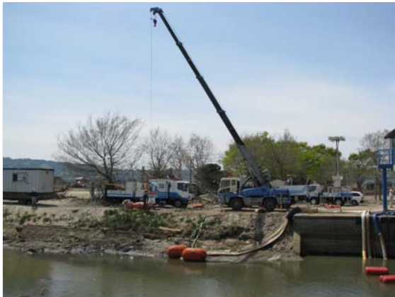
60t ポンプ撤去状況 (5/9)