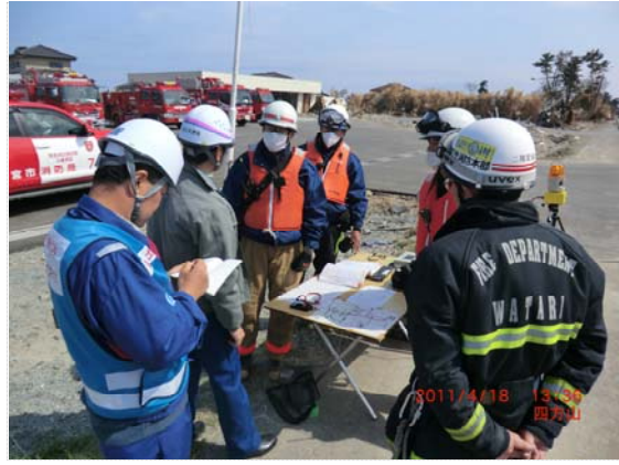
消防団との情報交換状況 (4/18)