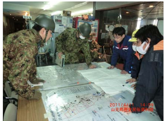
自衛隊との打合せ状況 (4/11)