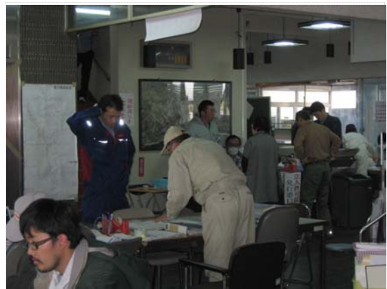
町担当者との打合せ状況 (4/14)