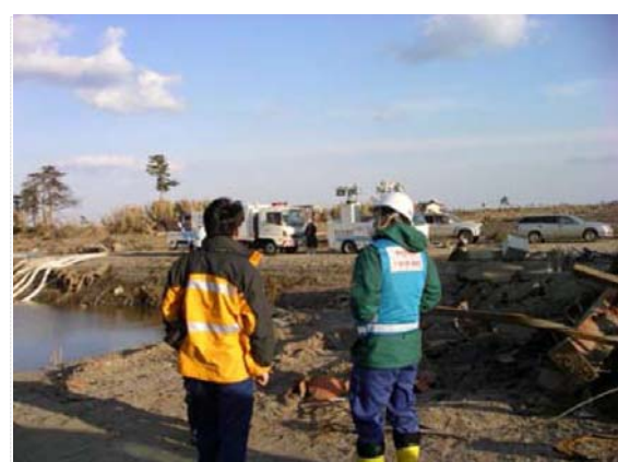
TEC-FORCE との現地打合せ状況 (4/3)