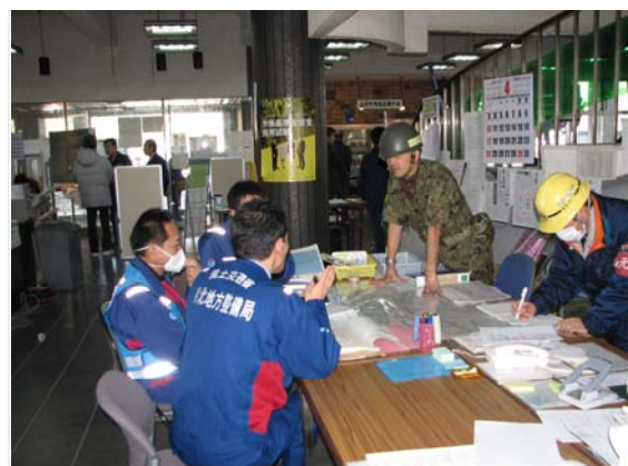
自衛隊との打合せ状況 (4/5)