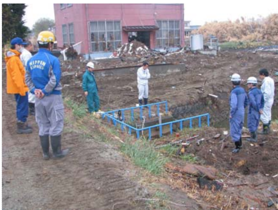
ポンプ車設置場所確認状況 (5/12)