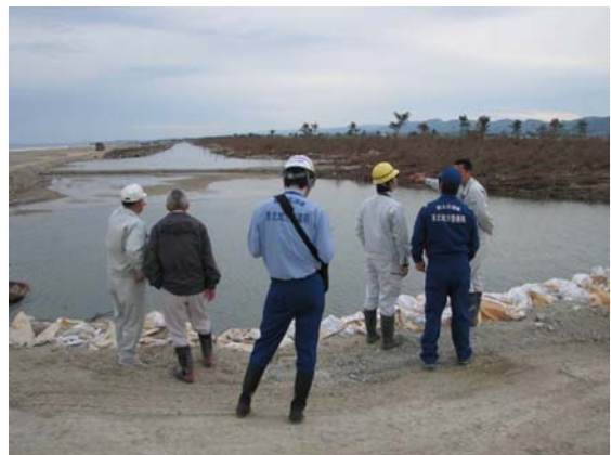
町・土地改良区との現地調査 (5/10)