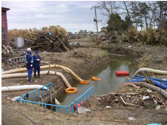
花笠排水機場水位確認状況 (4/20)