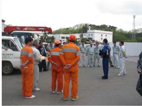
排水ポンプ稼働打合せ (5/7)