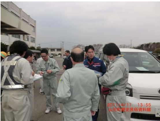
整備局との打合せ状況 (4/11)