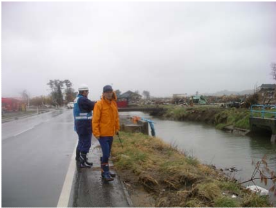
花笠地区水路水位確認状況 (4/19)