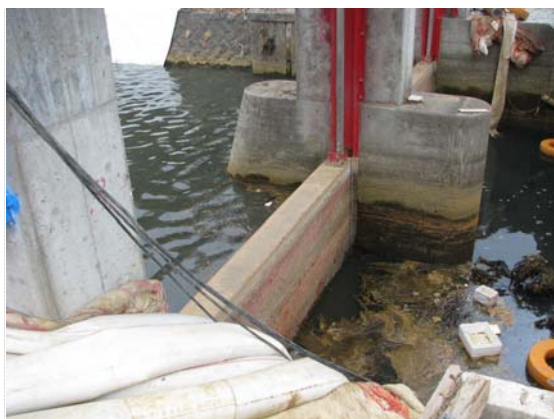
鷺足川排水路ゲート部水位差 (4/30)