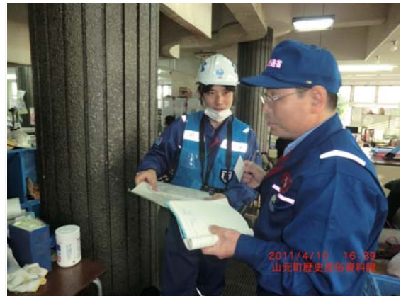
TEC-FORCE との打合せ状況 (4/10)