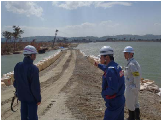
ポンプ車設置場所確認状況 (5/13)