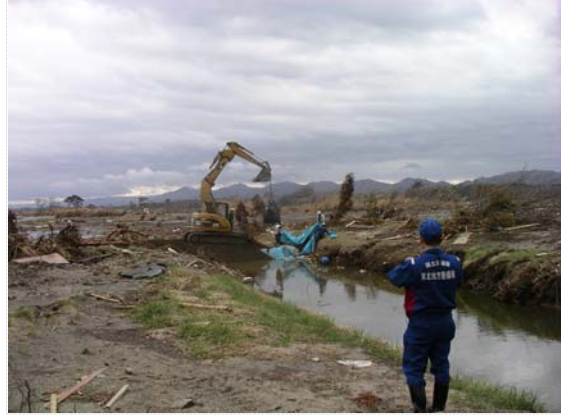
水路止水作業確認状況 (4/20)