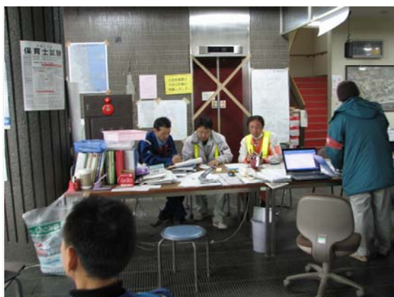
路面清掃担当者との打合せ状況 (4/5)