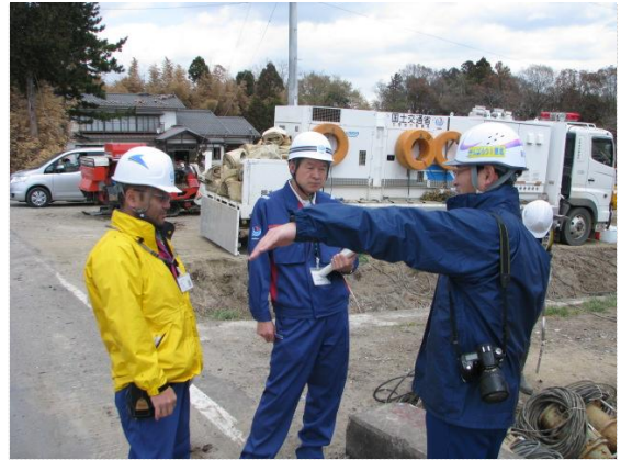
TEC-FORCE との現地打合せ (4/29)