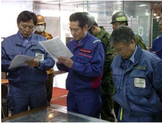
国土交通政務官・内閣府副大臣及び参事官来庁 (4/1)