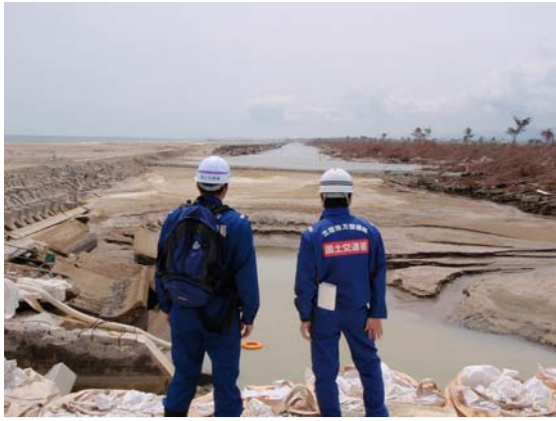
TEC-FORCE との現地打合せ状況 (5/24)