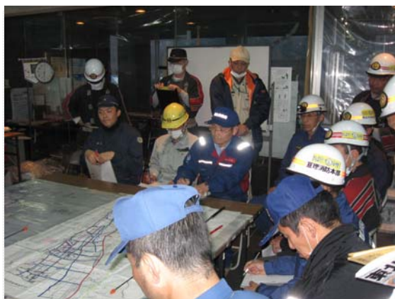
災害対策本部会議状況 (4/15)