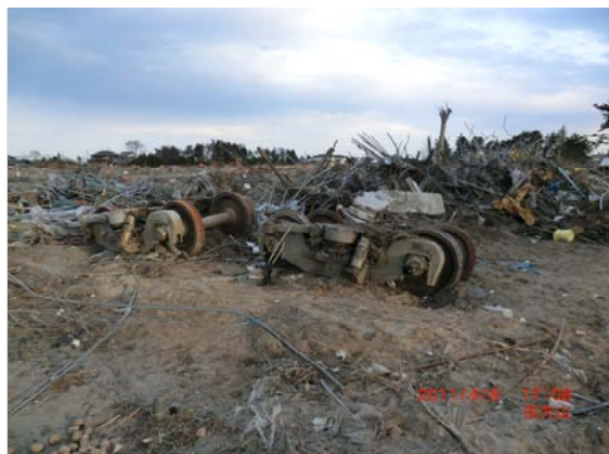
JR 貨物線被災状況 (4/8)