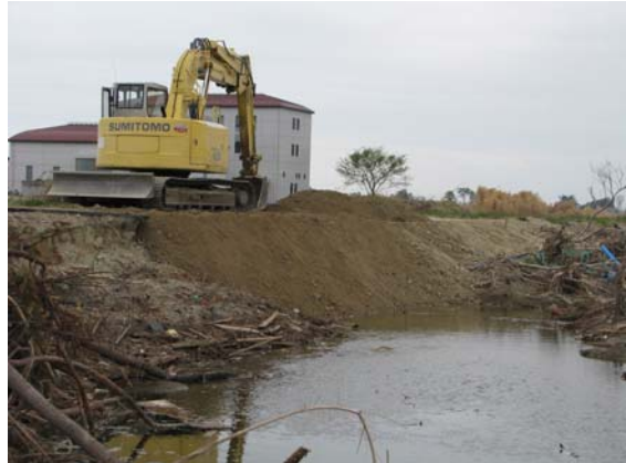
高瀬川上流部堤防修復状況 (5/6)