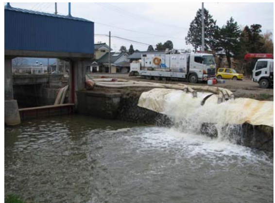
鷺足川排水路排水状況 (4/30)