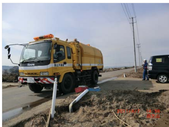
路面清掃状況確認・農免道 (4/7)