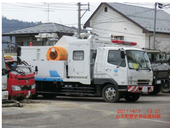
国交省排水ポンプ車 (4/7)