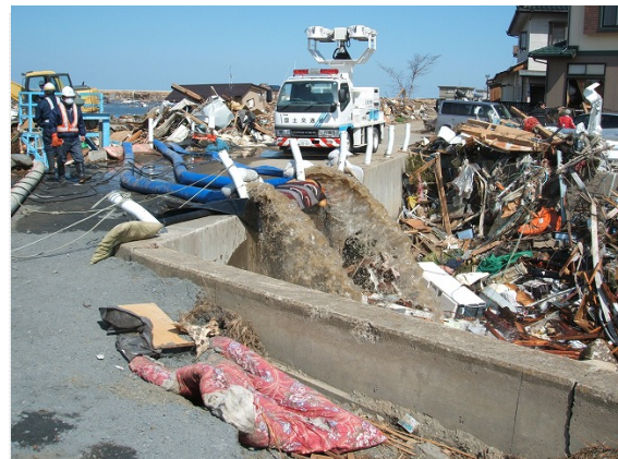
亙理町荒浜排水作業状況 (3/24)