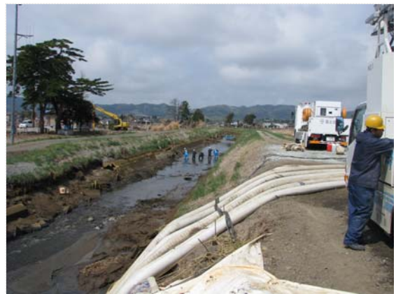
排水ポンプ車稼働状況確認 (5/4)