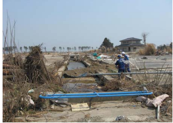
笠野地区止水状況確認 (4/13)