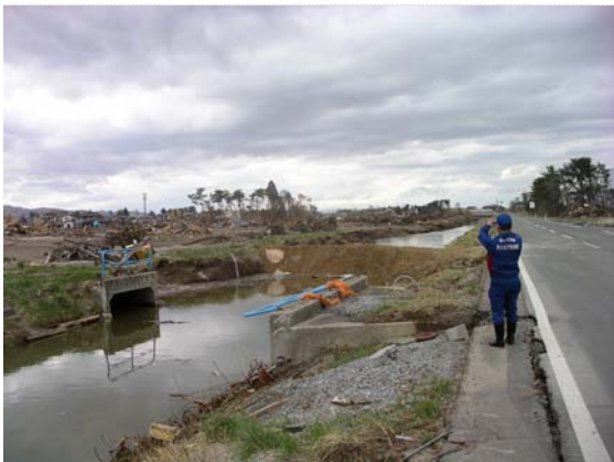
水路止水完了箇所確認状況 (4/20)