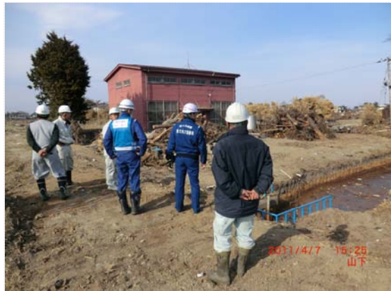
排水ポンプ車展開状況確認 (4/7)