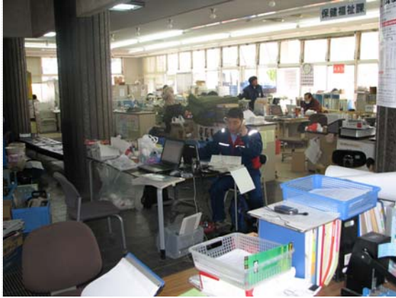
リエゾン活動状況 (4/4)