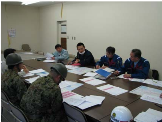
自衛隊捜索活動に伴う打合せ (5/4)