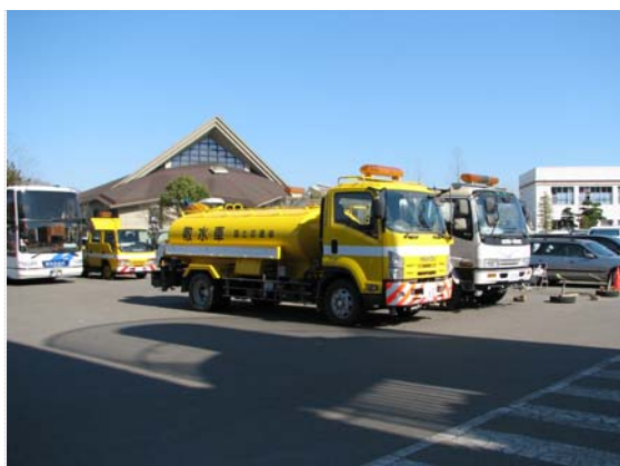
国土交通省散水車 (4/6)