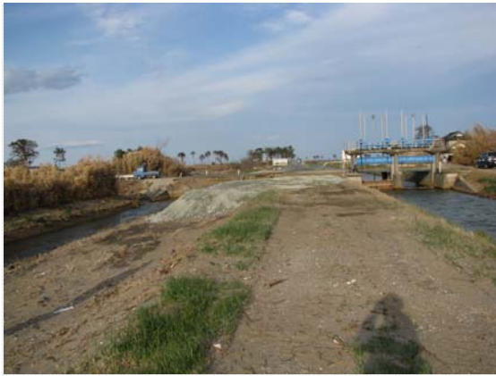
排水ポンプ車設置ヤード造成 (5/2)