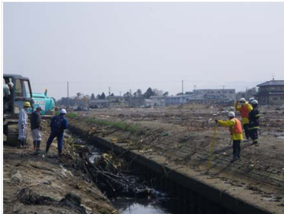
瓦礫撤去・搜索状況 (4/27)