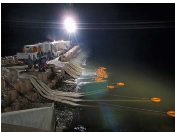
夜間・排水ポンプ車稼働状況 (5/20)