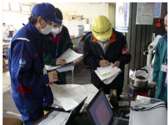
町・TEC-FORCE との打合せ (4/2)