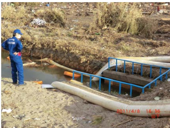
排水ポンプ車展開状況確認 (4/8)