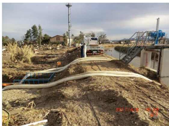
排水ポンプ車展開状況 (4/8)