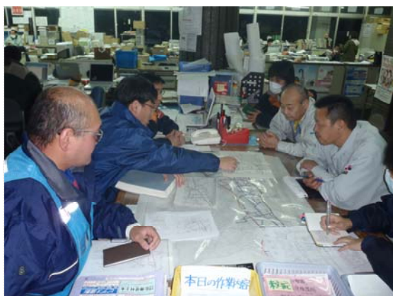
土地改良区との打合せ (4/22)