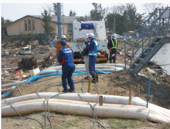
花笠排水機場現地確認状況 (4/13)