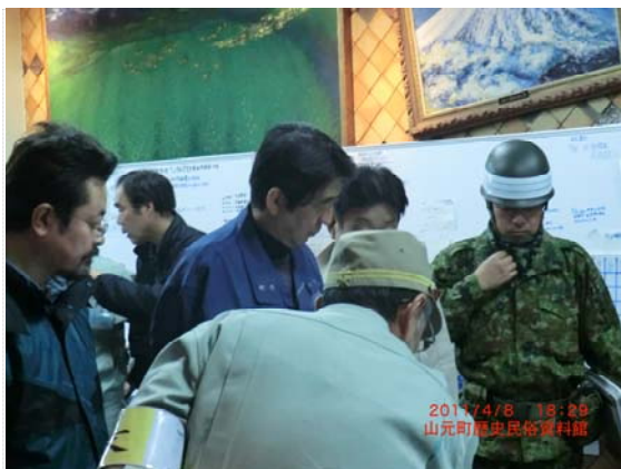
安倍晋三議員現地視察 (4/8)