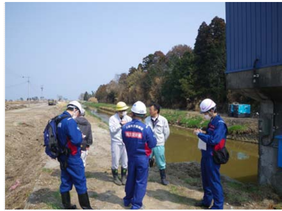
排水ポンプ設置協議 (4/27)