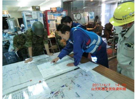
山本町・自衛隊との打合せ状況 (4/7)