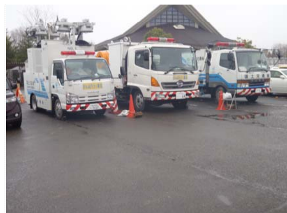
国土交通省災害対策車両 (4/22)