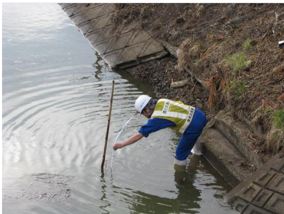
排水前水深確認状況 (4/29)