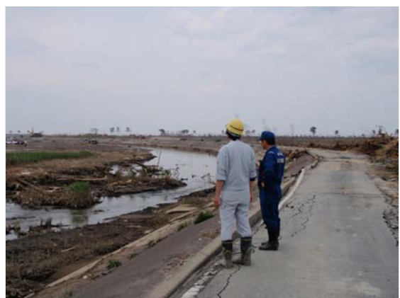
導水路掘削位置確認状況 (5/21)