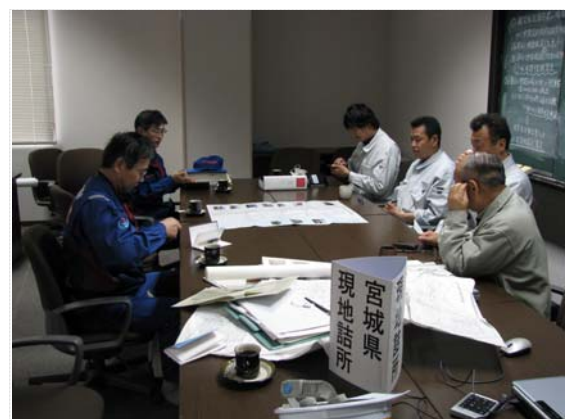
土地改良区・TEC-FORCE との 打合せ (5/2)