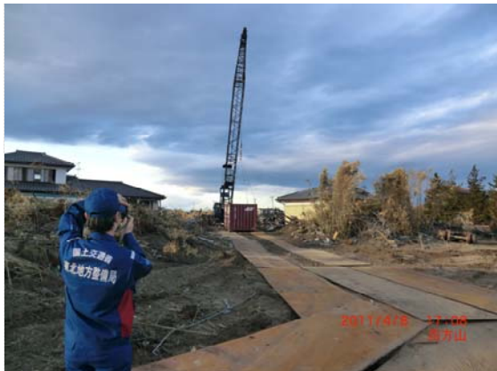
JR 貨物線撤去状況 (4/8)