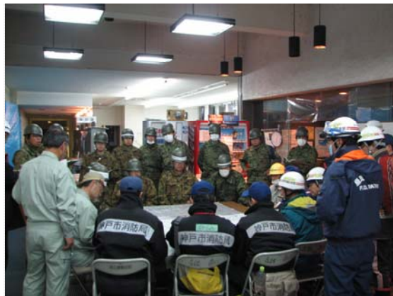
対策本部全体会議 (4/6)