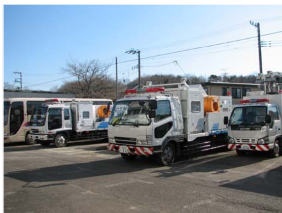
国土交通省排水ポンプ車 (4/6)