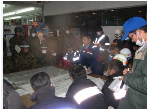
対策本部全体会議 (4/4)