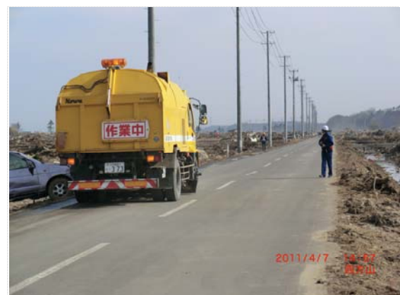
路面清掃状況確認・農免道 (4/7)