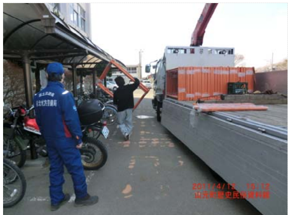
資材搬入確認状況 (4/12)