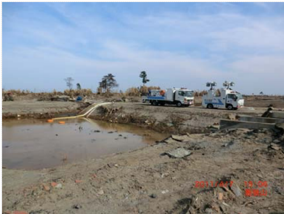
排水ポンプ車展開状況 (4/7)