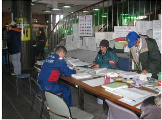
リエゾン活動状況 (4/4)