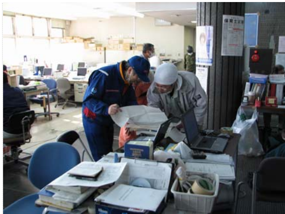
リエゾン活動状況 (4/6)