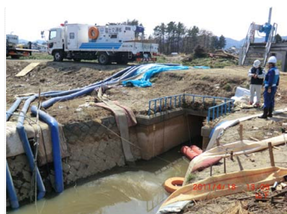
花笠排水機場水位確認状況 (4/18)