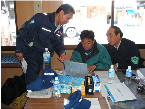
亙理町職員と打合せ (3/24)