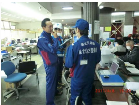
TEC-FORCE 打合せ状況 (4/8)