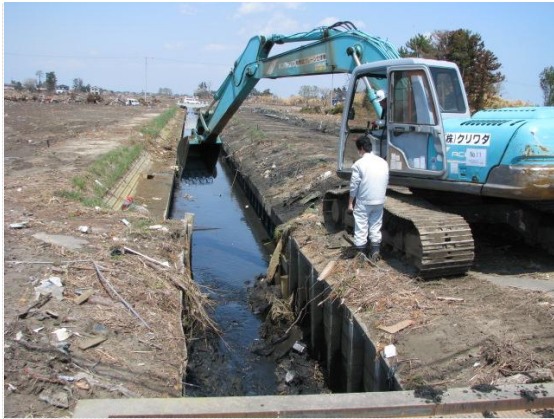
がれき撤去状況確認 (4/28)