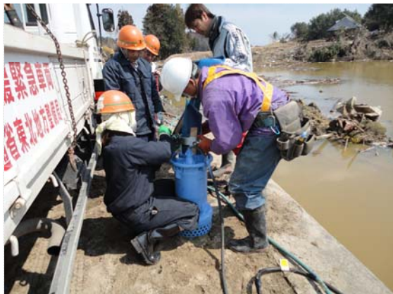
水中ポンプ取付状況 (3/31)