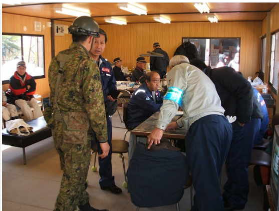
亙理町災害対策本部打合せ状況 (3/24)