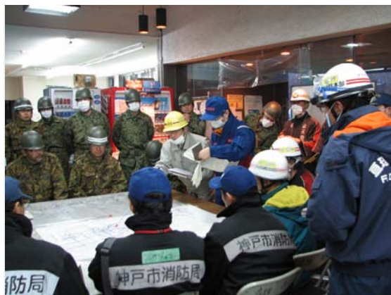
対策本部全体会議での報告 (4/6)