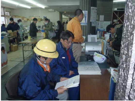
山元町との打合せ (4/22)