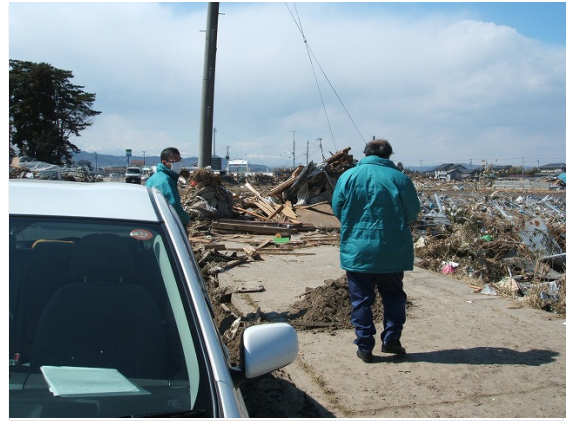
リエゾンによる状況確認 (3/24)