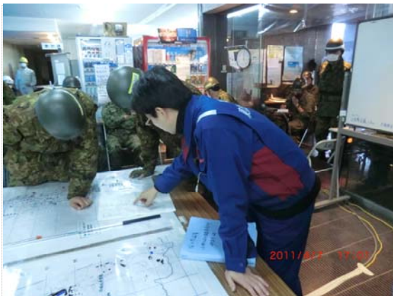
自衛隊との打合せ状況 (4/7)