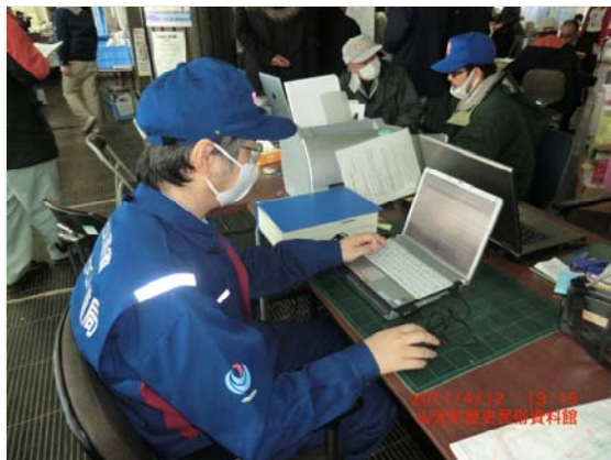
リエゾン活動状況 (4/12)