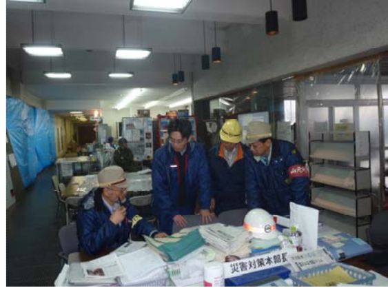
山元町・町長との打合せ (4/22)