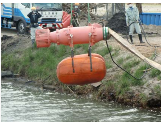
排水ポンプ設置状況 (5/7)