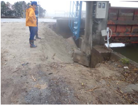
ゲートの状況確認 (4/23)