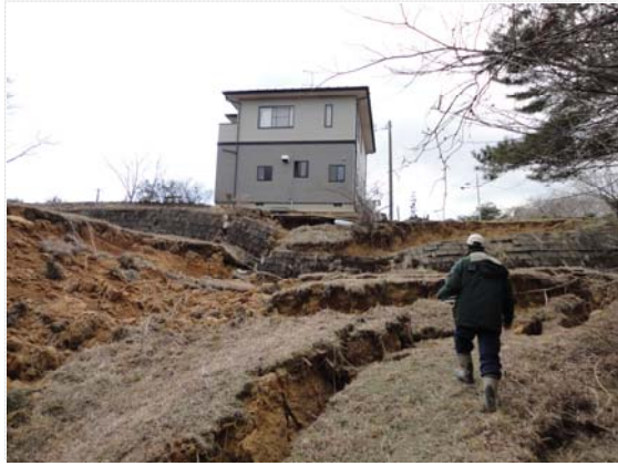
町道盛土部崩壊の調査 (3/28)