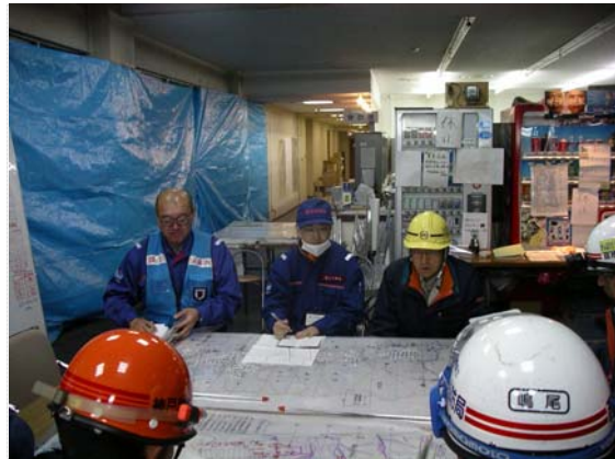
災害対策本部合同会議状況 (4/21)