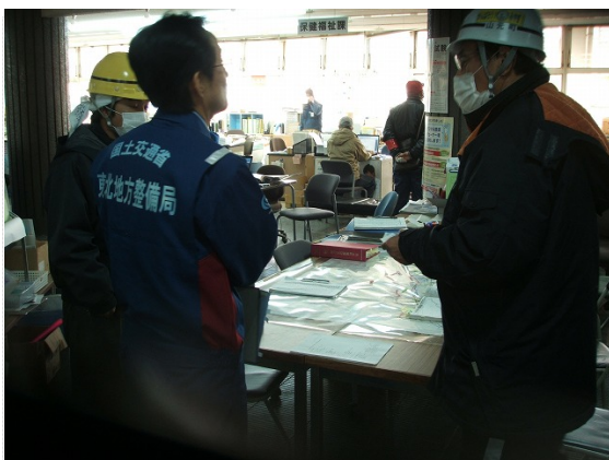
山元町災害対策本部打合せ状況 (3/24)