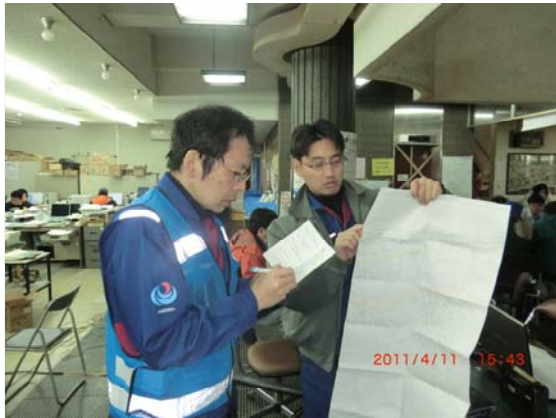
TEC-FORCE との打合せ状況 (4/11)