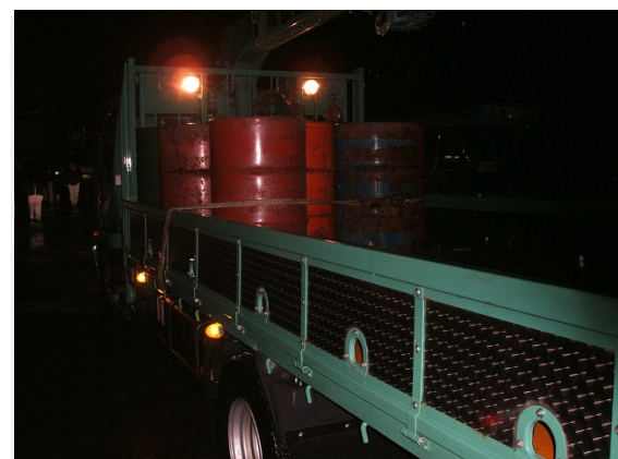
軽油引渡し・立会い確認 (3/25)