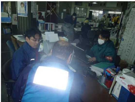
TEC-FORCE との打合せ (4/22)