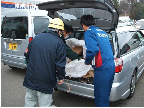
山元町へ資材引渡し・立会い (3/25)