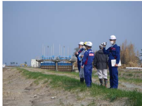
排水ポンプ設置箇所調査 (4/27)