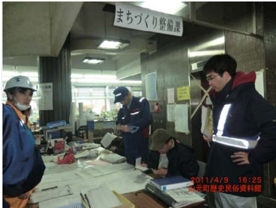
リエゾン打合せ状況 (4/9)