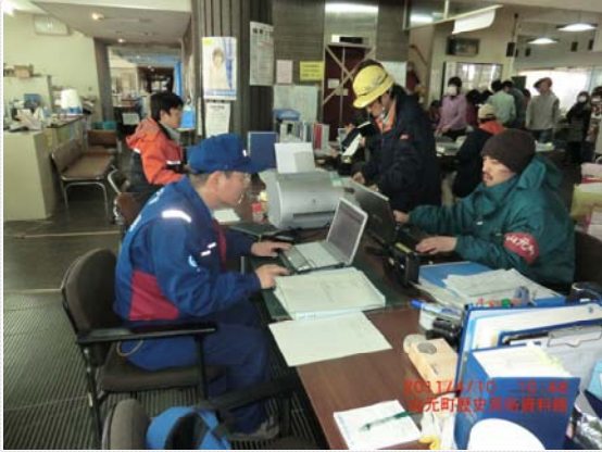
リエゾン活動状況 (4/10)