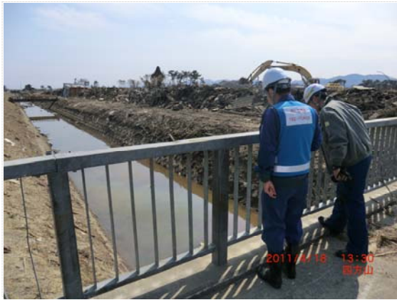
花笠地区水路水位確認状況 (4/18)