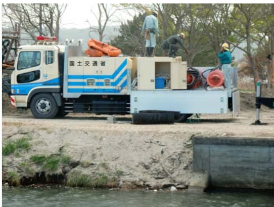
30t ポンプ車 (5/7)