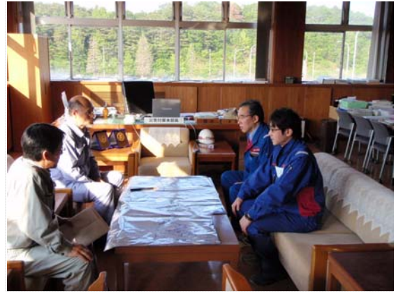
町長への排水作業終了報告 (5/24)