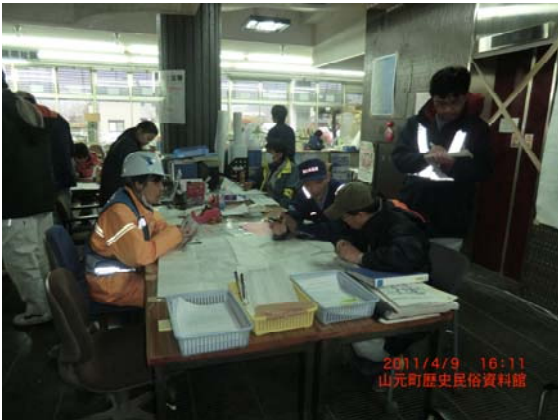
リエゾン打合せ状況 (4/9)