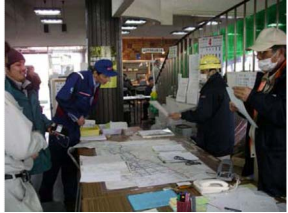
リエゾン打合せ状況 (4/1)