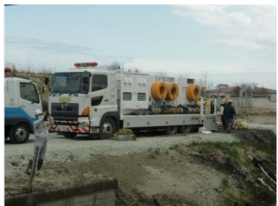
60t ポンプ車 (5/7)