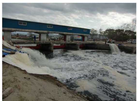
高瀬川排水ゲート排水状況確認 (5/7)