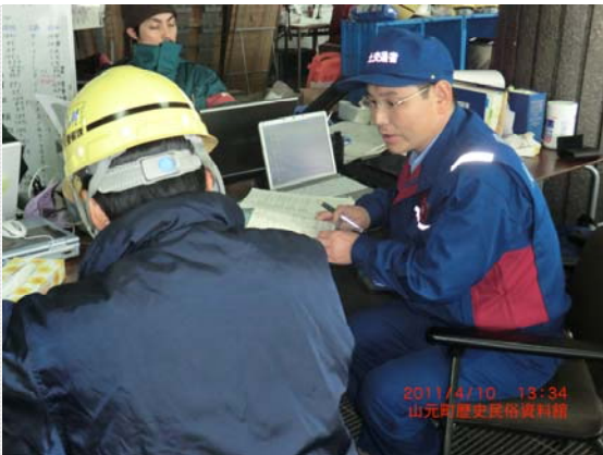
リエゾン打合せ状況 (4/10)