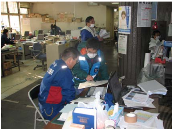
TEC-FORCE との打合せ状況 (4/4)