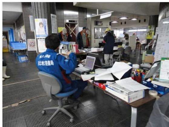
リエゾン活動状況 (3/31)