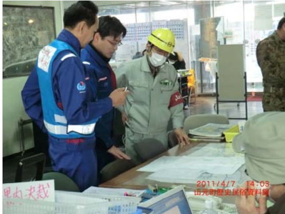
山本町との打合せ状況 (4/7)