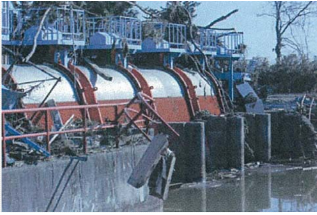
下増田ポンプ場稼働状況 (4/6)