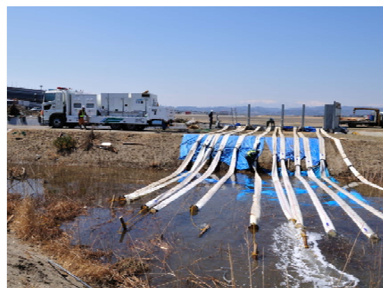
仙台空港アクセス鉄道排水状況確認 (4/1)