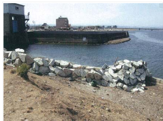
閑上水門付近被災状況 (4/18)