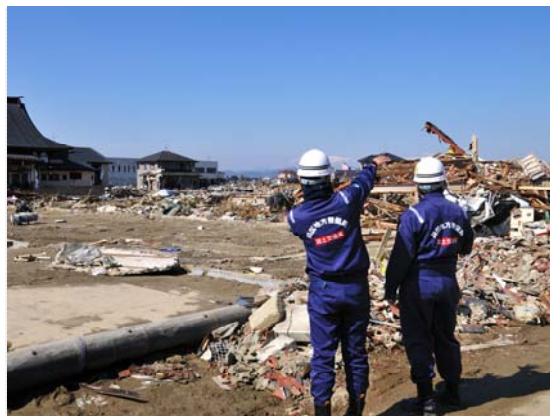
閑上地区現地調査状況 (4/1)