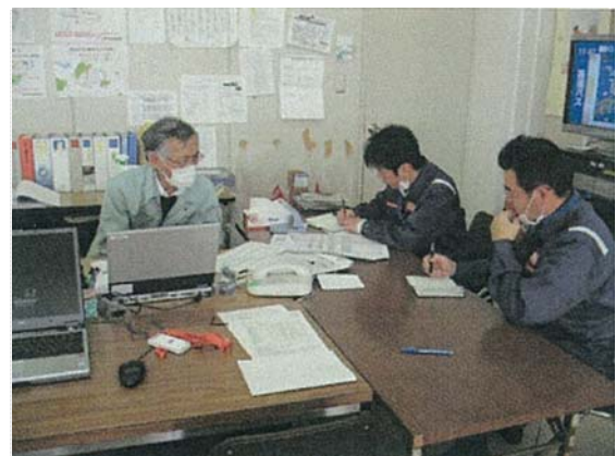
市職員からの情報収集 (4/5)