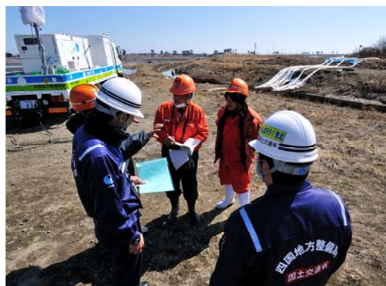
小原地区排水状況確認 (4/1)