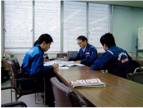
現地視察者対応状況（4/22）