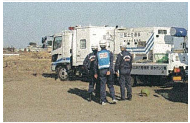
TEC-FORCE との打合せ状況 (4/6)