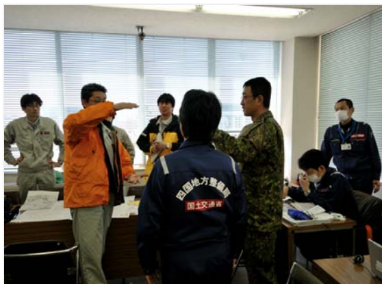
自衛隊とポンプ班との打合せ状況(4/1)