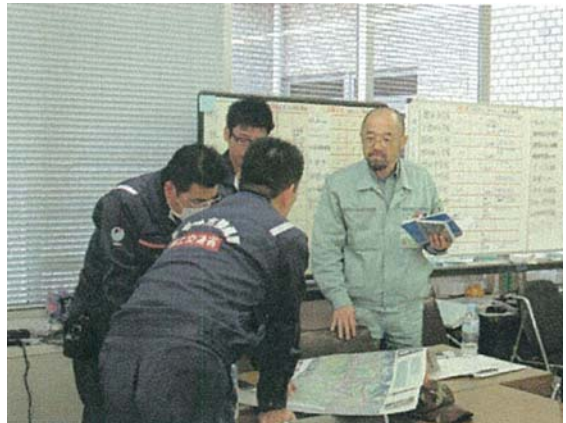
市職員との打合せ状況 (4/4)