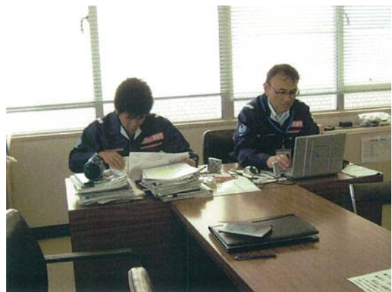
リエゾン活動状況 (4/17)