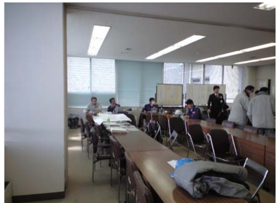
災害対策本部の様子