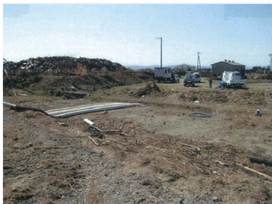
小塚原地区排水ポンプ稼働状況 (4/17)