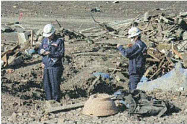
排水ポンプ稼働状況調査 (4/6)