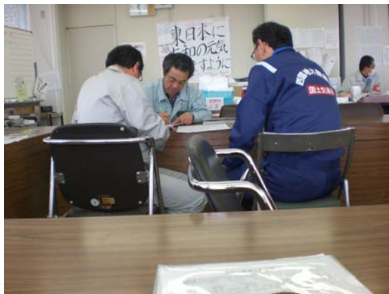
市担当者との打合せ状況 (4/15)