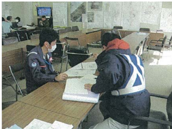
TEC-FORCE との打合せ状況 (4/4)