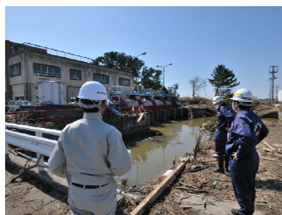
閑上排水機場状況確認 (4/1)