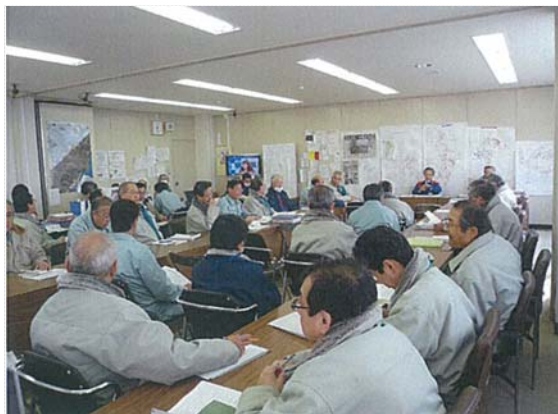
対策本部日毎会議（3/30）