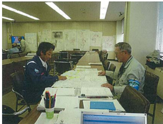
リエゾンと排水状況打合せ（3/31）