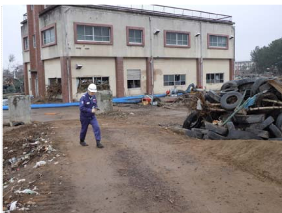
閑上排水機場排水状況 (4/9)