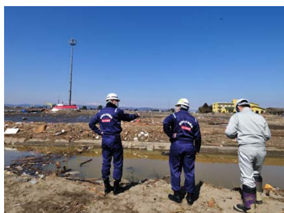
閑上地区排水状況確認 (4/1)