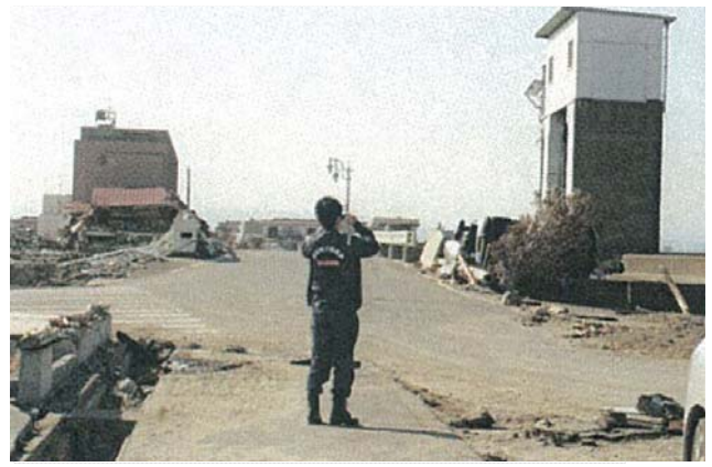
閑上水門現地調査 (4/6)