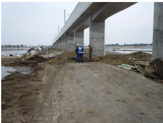
下松田地区排水機設置箇所調査 (4/7)