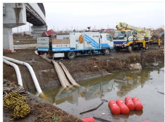
下松田地区排水ポンプ車稼働状況 (4/9)