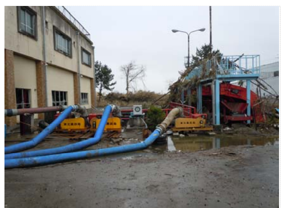
閑上排水機場排水状況 (4/9)