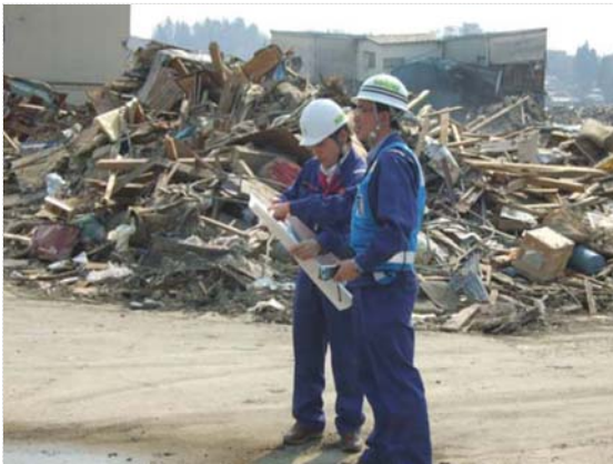
中みなと町現地確認 (4/14)