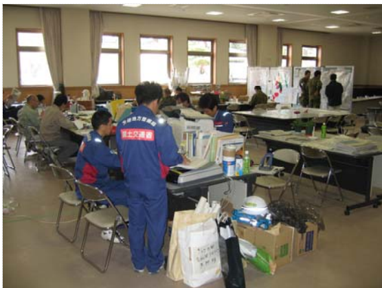
リエゾン活動状況 (4/16)