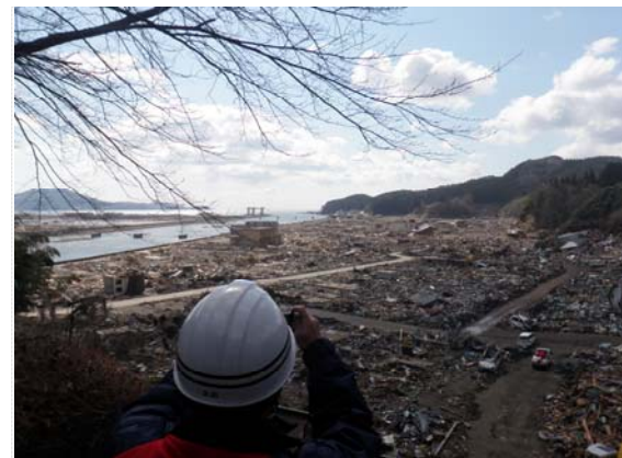
国道 45 号線付近 (3/27)