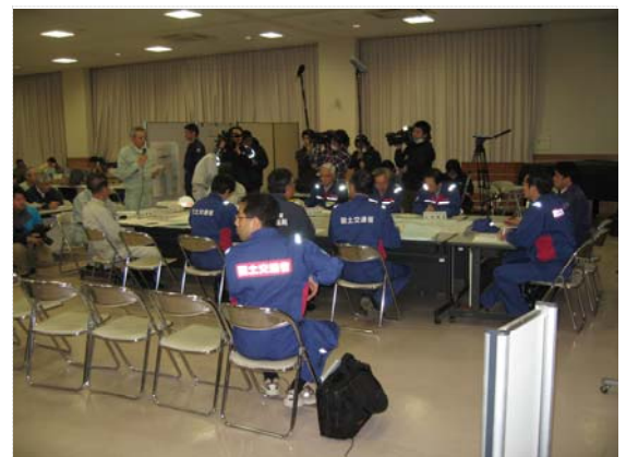
気仙沼市長からの要望状況 (4/16)