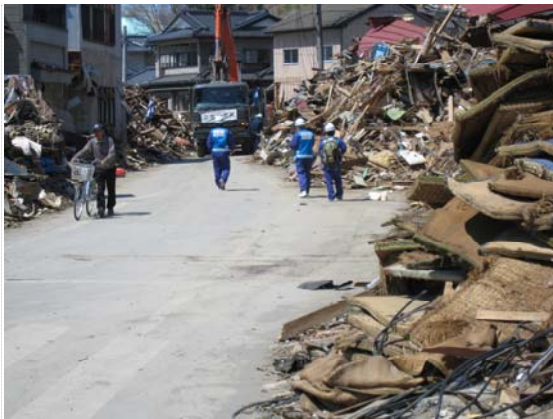
市担当者との打合せ状況 (4/17)