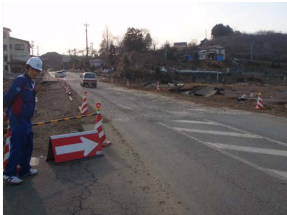
国道 45 号路面状況確認 (4/1)