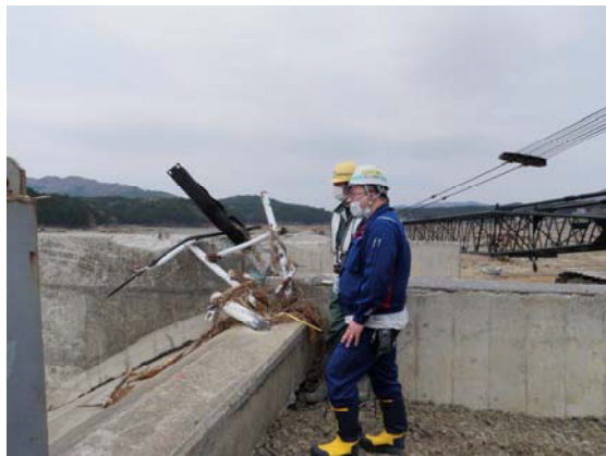
小泉大橋復旧工事確認 (4/30)