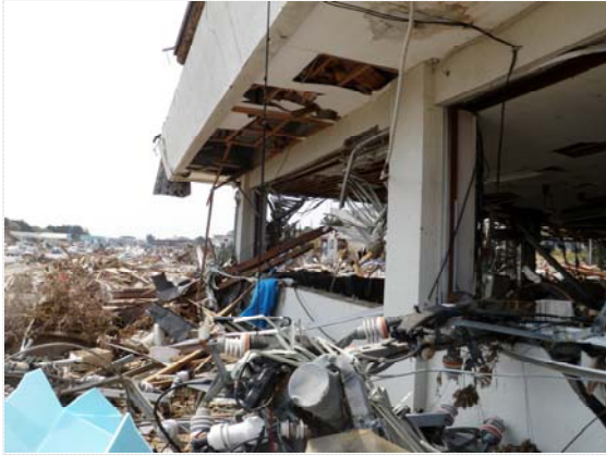
気仙沼国道維持(出)被災状況 (4/30)