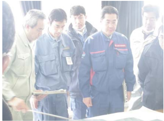
国土交通政務官・内閣府政務官 現地視察 (3/23)