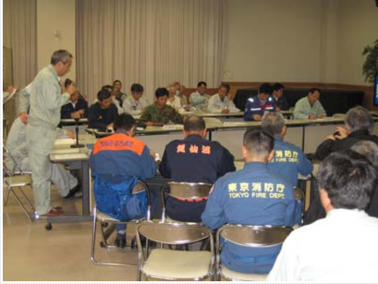
災害対策本部会議状況（4/16）