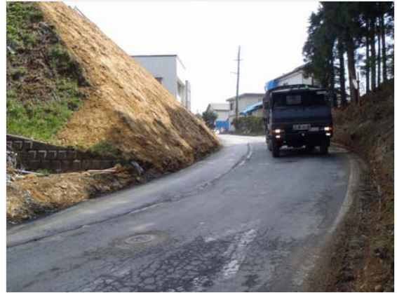
歌津大橋迂回路完成状況 (5/4)