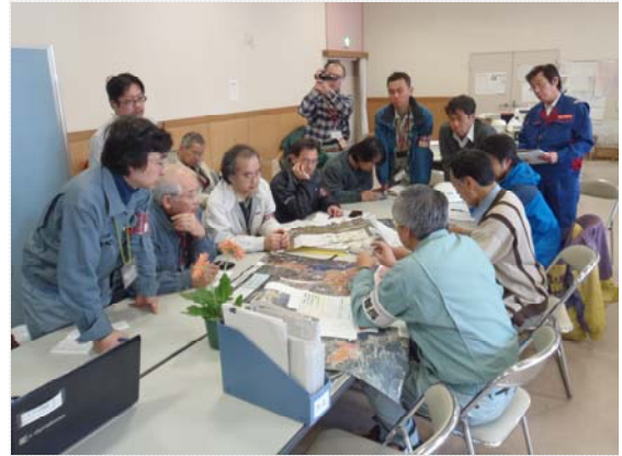
市町・土木学会との会談 (4/5)