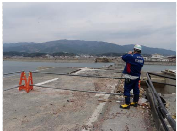
気仙大橋仮橋設置工事確認 (4/30)