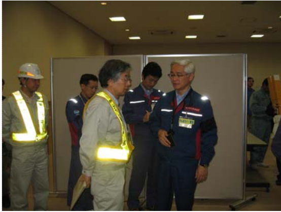
徳山東北地方整備局長と 齋藤三陸国道事務所長 (4/16)