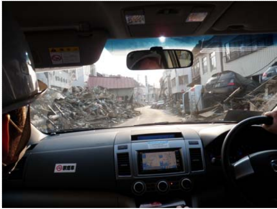
市内被災状況確認 (3/29)