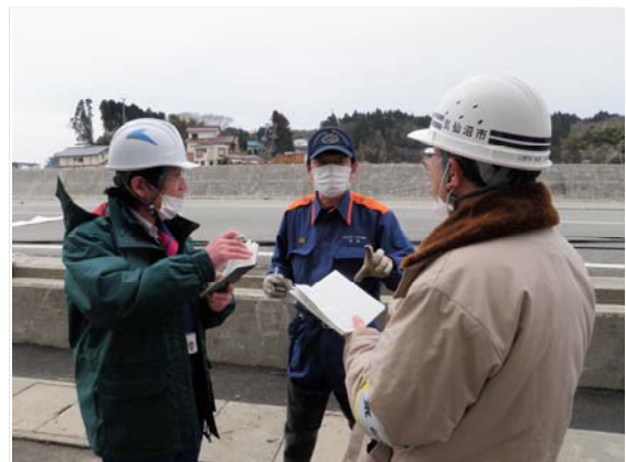
市下水道課・消防署との打合せ (4/8)