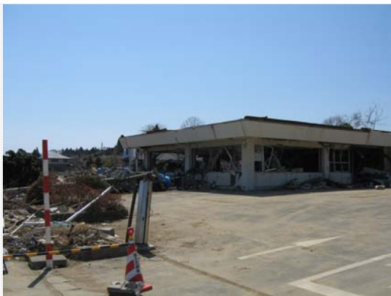
気仙沼国道維持出張所正面 (4/18)