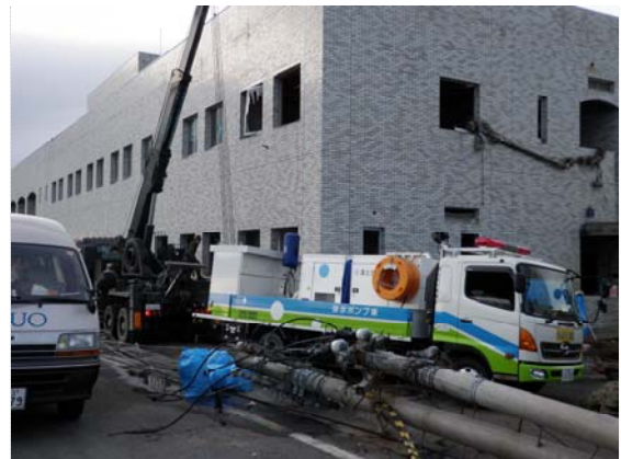
排水ポンプ車復旧状況 (4/8)