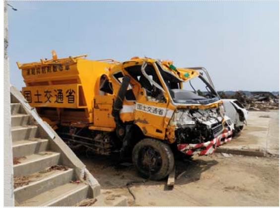
気仙沼国道維持(出)被災状況 (4/30)