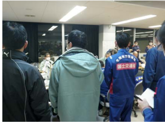
災害対策本部全体会議 (3/29)