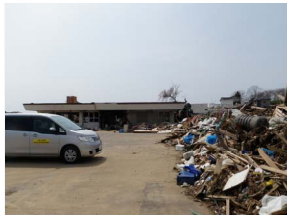
気仙沼国道維持(出)被災状況 (4/30)