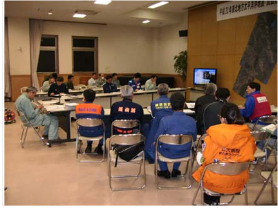
災害対策本部会議状況（4/20）