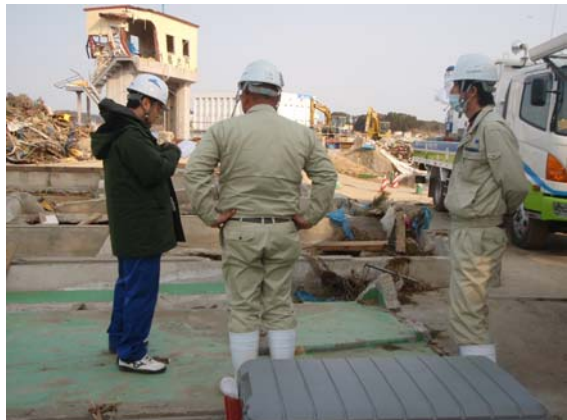
排水ポンプ車稼状況確認 (4/23)