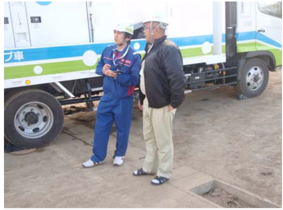
排水ポンプ車稼状況確認 (4/1)