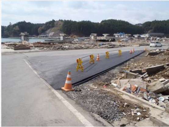
歌津大橋迂回路完成状況 (5/4)