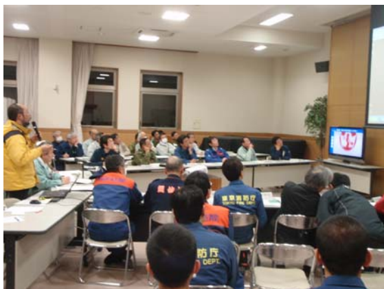
災害対策本部全体会議 (4/2)