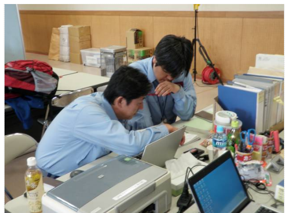
リエゾン引継ぎ状況 (5/9)