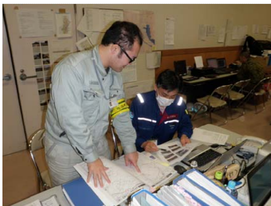
打合せ・報告書作成状況 (4/30)