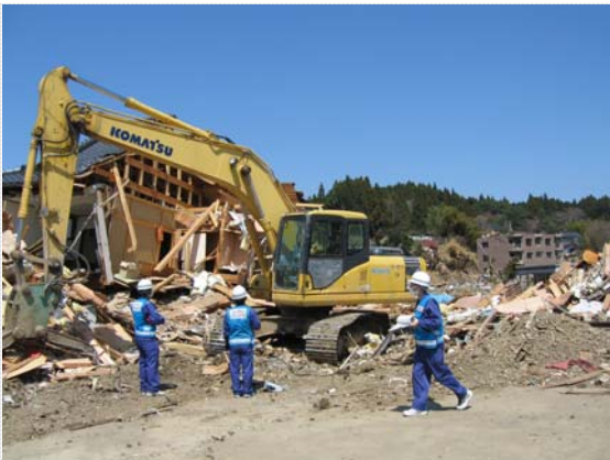
瓦礫撤去バックホウ確認状況（4/17）