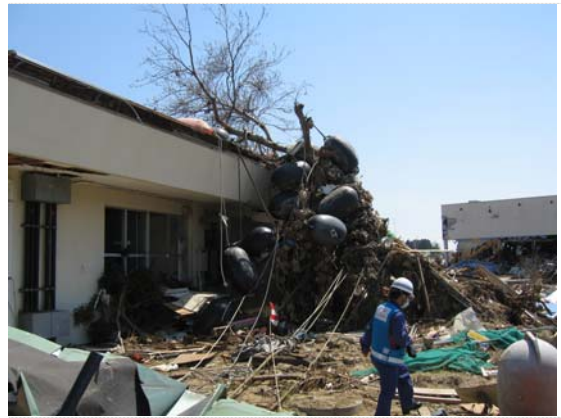
気仙沼出張所確認状況（4/18）