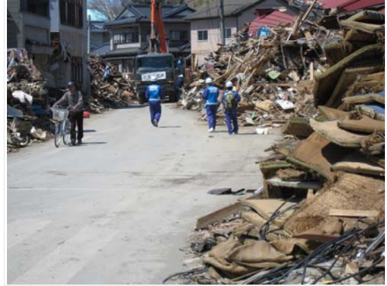
瓦礫除去バックホウ確認の 現地調査状況（4/17）