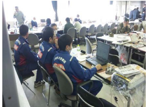
リエゾン作業状況 (3/25)