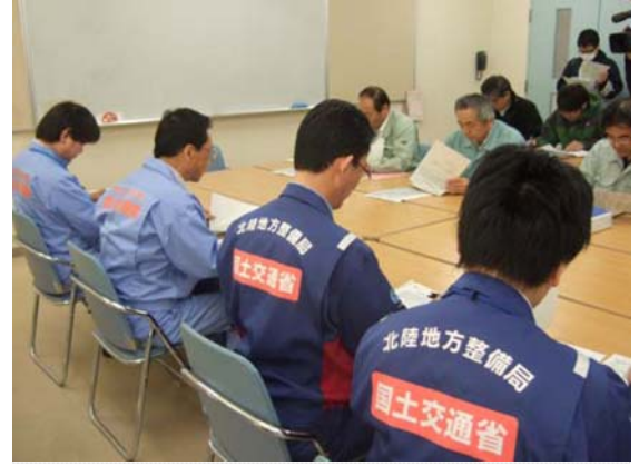
地盤沈下調査検討会 (4/14)