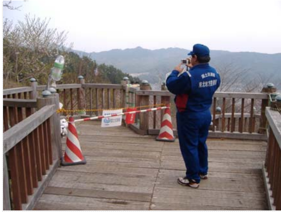
津波監視カメラの電波状況調査 (4/27)