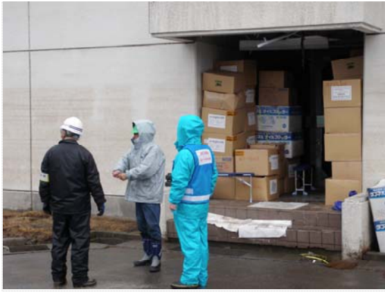
オイルマット現着確認状況 (4/9)