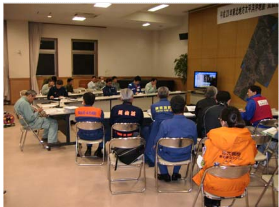
対策本部全体会議 (4/20)