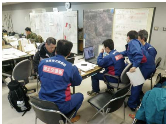
災害対策本部打合せ状況 (3/26)