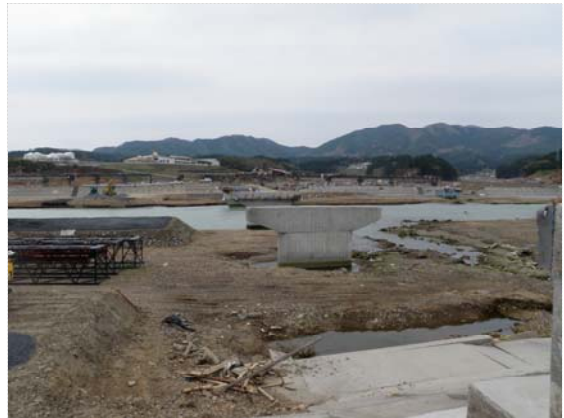
小泉大橋復旧工事状況 (4/30)