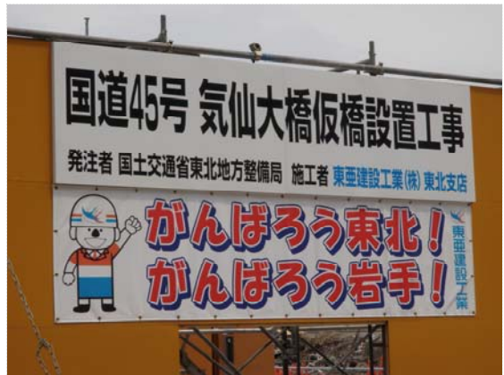
気仙大橋仮橋設置工事状況 (4/30)