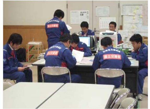
リエゾン引継ぎ状況 (4/14)