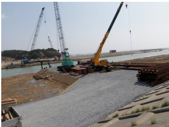
小泉大橋・仮設 H 鋼杭基礎施工状況 (5/8)