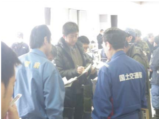
国土交通政務官・内閣府政務官 現地視察 (3/23)