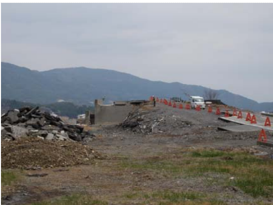
気仙大橋仮橋設置工事状況 (4/30)