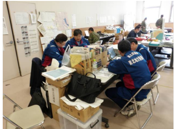
リエゾン引継ぎ状況 (4/29)