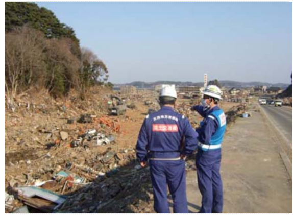
県道 26 号被災状況確認 (4/13)