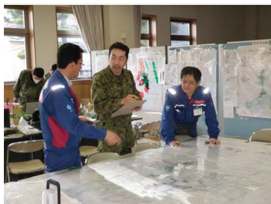
陸上自衛隊との打合せ状況 (4/8)