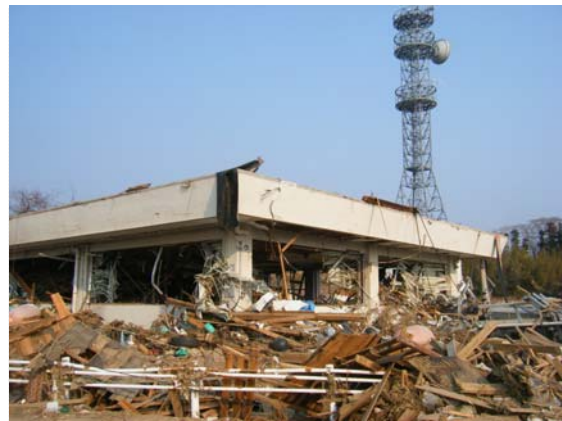
気仙沼国道維持出張所 (3/30)