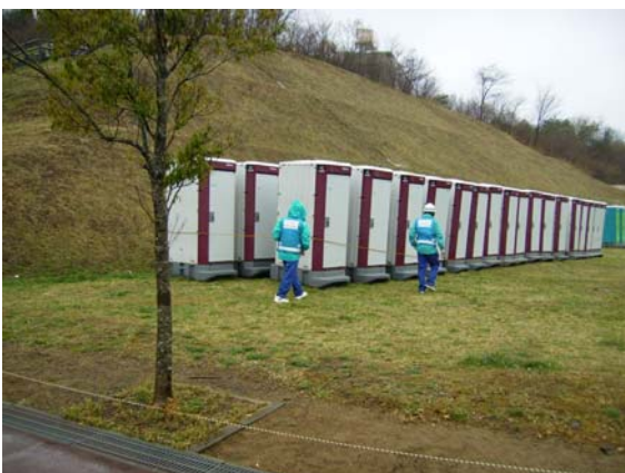
仮設トイレ設置箇所・個数 調査状況（4/19）