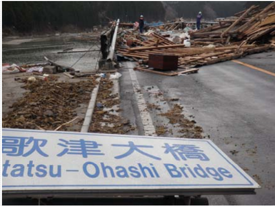
国道 45 号線付近 (3/28)