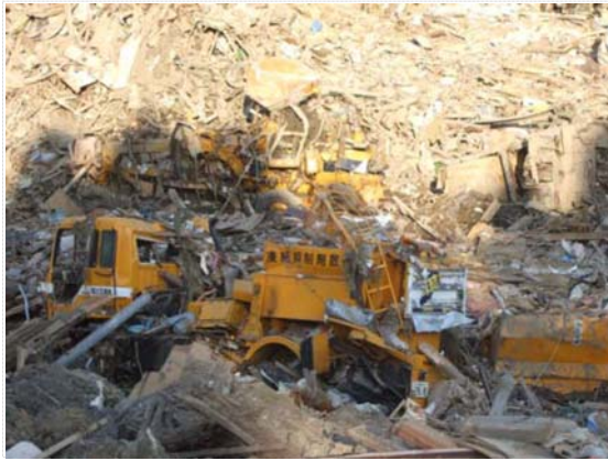
凍結抑制剤散布車被災状況 (4/13)