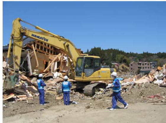
瓦礫除去バックホーの現地確認 (4/17)