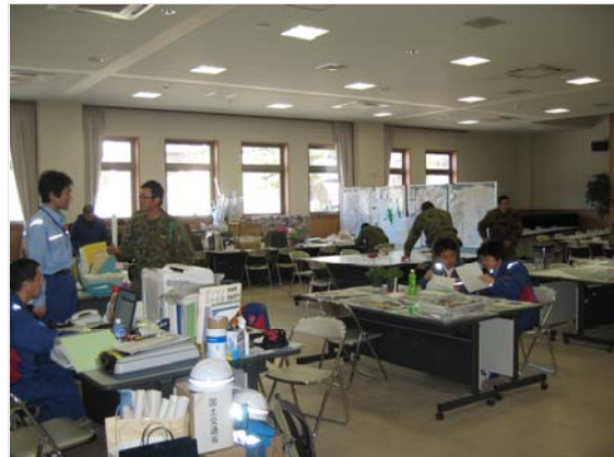
陸上自衛隊との打合せ状況 (4/17)