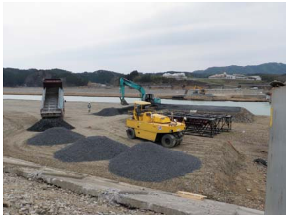
小泉大橋復旧工事状況 (4/30)