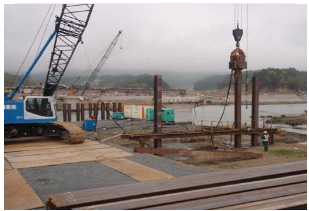
小泉大橋・仮設 H 鋼杭基礎施工状況 (5/12)