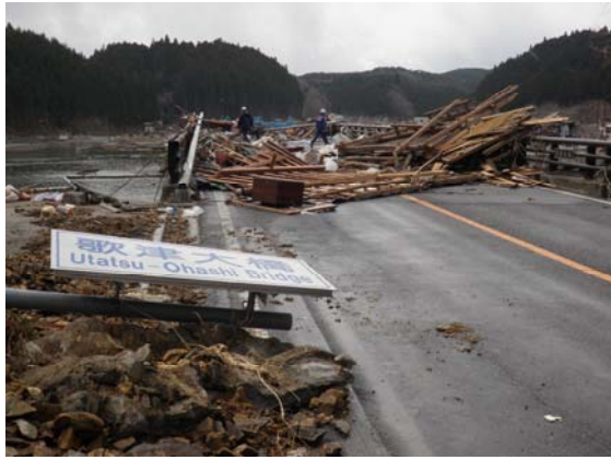
国道 45 号線付近 (3/28)