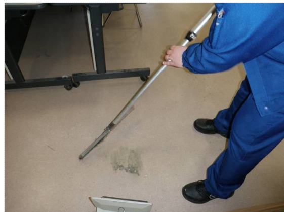
災害対策本部清掃活動状況 (4/30)