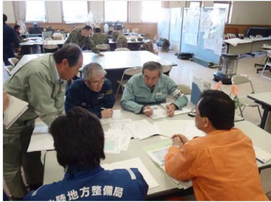
国土地理院との会談 (4/5)