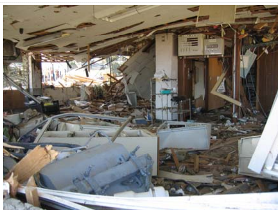
同出張所内被災状況 (4/18)