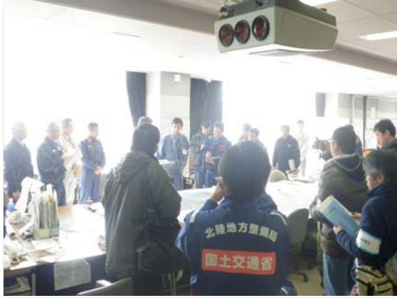
国土交通政務官・内閣府政務官 現地視察 (3/23)