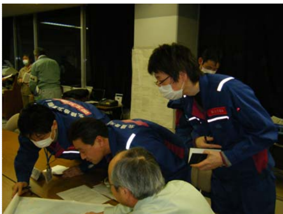
気仙沼市との打合せ状況 (3/30)