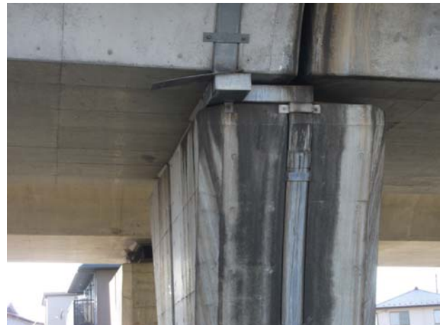
P12（上り線）排水装置損傷、防食剤漏出 伸縮継手損傷か大音発生