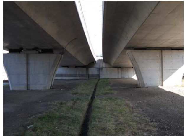
左：A2（下り線） 変位制限構造周辺 Co 損傷・クラック