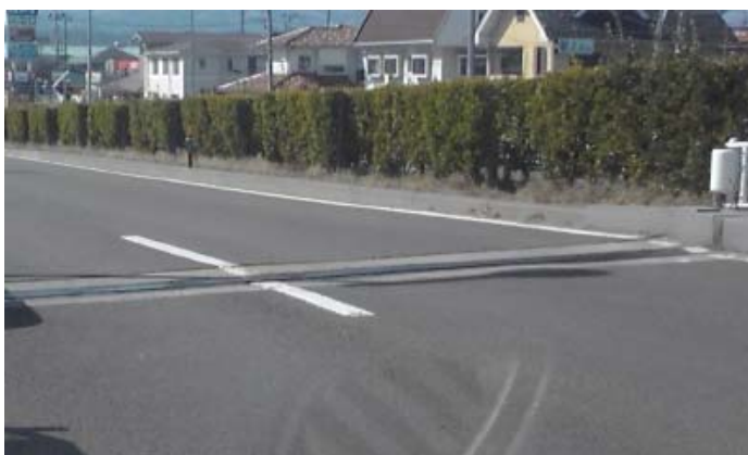
A1（上り線）伸縮継手損傷確認