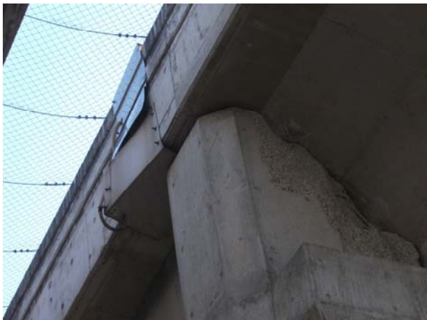
P5（下り線）壁高欄継手板損傷（米沢側から望む）