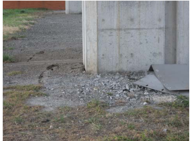
P9（下り線）地割れ・プレートとCo小片散乱