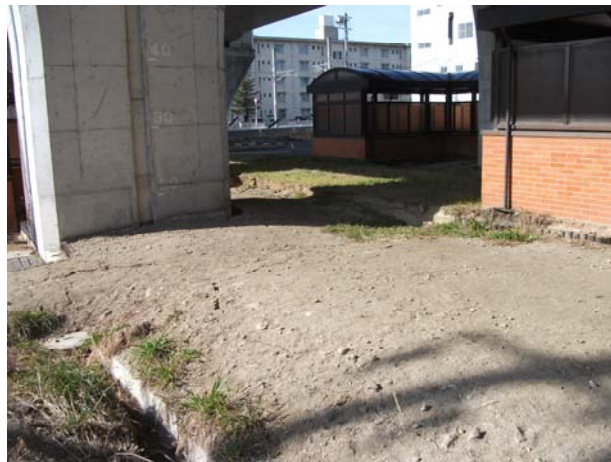
P6（上り線）付近地盤沈下・地割れ