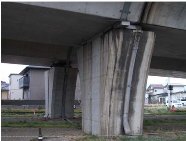
P12（上り線）排水装置損傷・防食剤漏出 増加大音発生（3・11本震時）