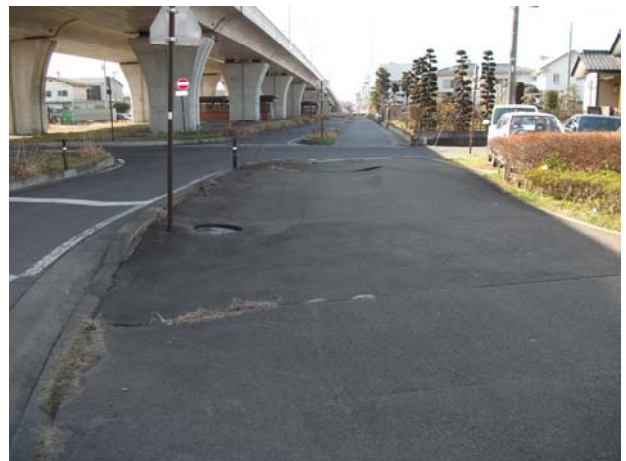
P10（下り線）周辺歩道部沈下