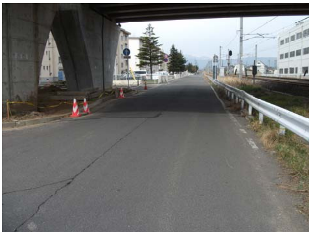
由添団地北側市道沈下状況