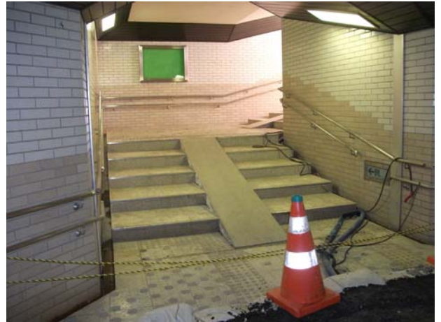
南側中間出入口 出入口沈下のため通行禁止中