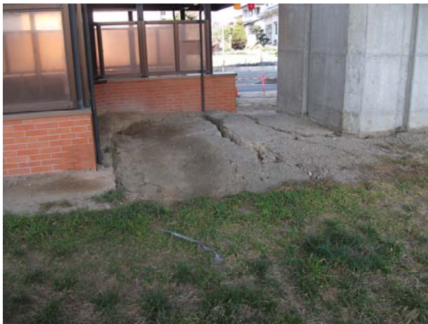
北側中間出入口（西）付近地盤沈下・地割れ状況