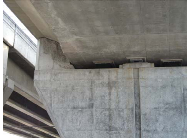
P5（下り線）変位制限構造 Co 破損