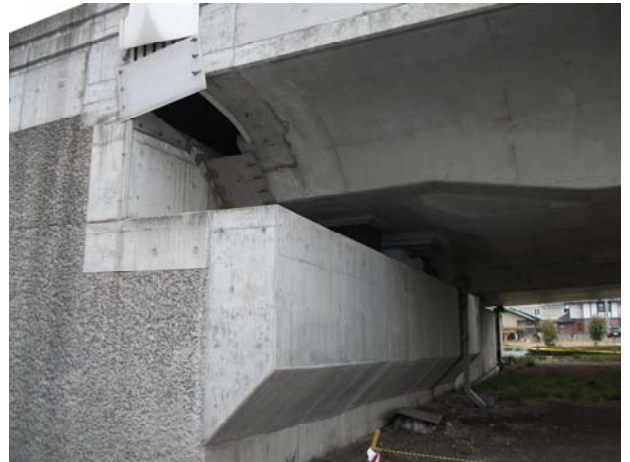
A2 橋台(下り線)伸縮継手損傷・ カバープレート撤去確（撤去要請）