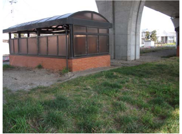
中間出入口（西）付近地盤沈下・地割れ状況