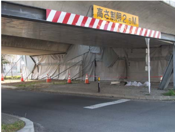
A1（上り線）伸縮継手応急復旧（防音）終了