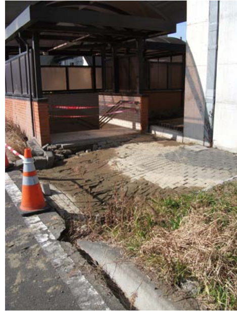
北側中間出入口口地盤沈下