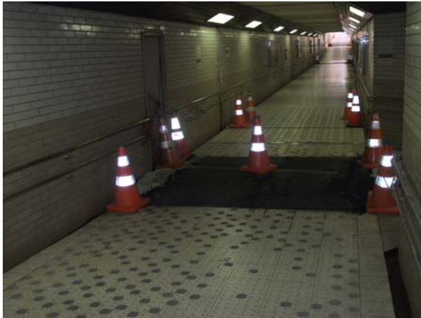
中間出入口からホースにより外部排水