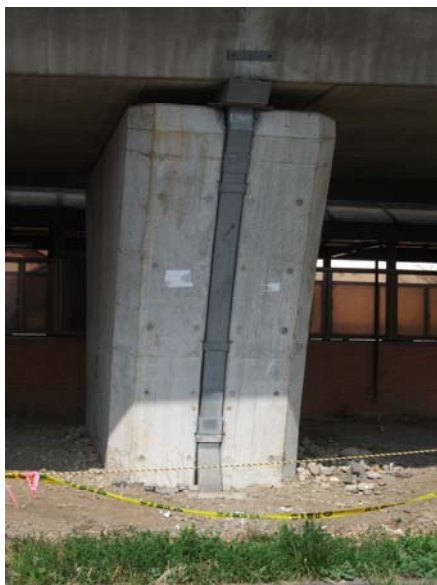
P1（下り線）排水装置損傷・破損 Co小片と止め金具散乱