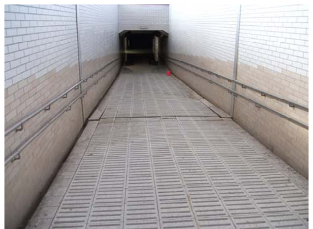
米沢側斜路損傷・湛水状況