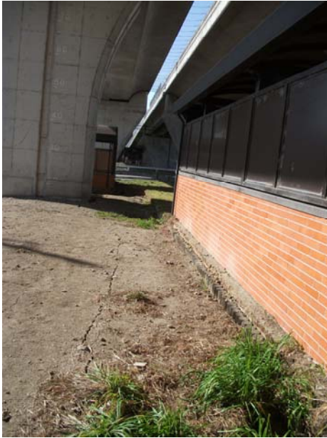
地割れ状況（P7 付近から P6 を望む）