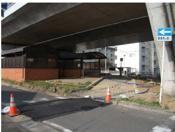
P4（上り線）線由添地下歩道