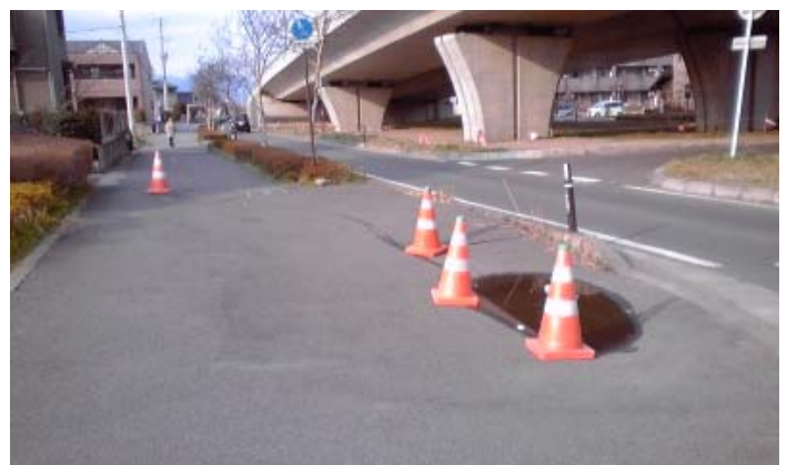
庭坂街道北側歩道沈下亀裂・波打ち 安全措置確認（H23.4.2）