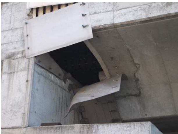
A2 橋台(下り線) 伸縮継手カバープレート損傷