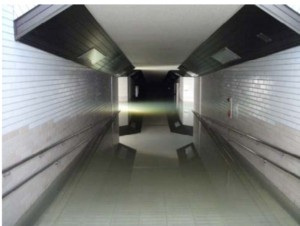
地下歩道水没状況（米沢側斜路より望む）