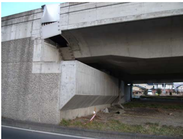
A2（下り線）伸縮継手カバプレート撤去確認