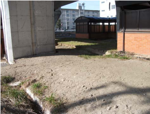
P6（上り線）付近地盤沈下・地割れ