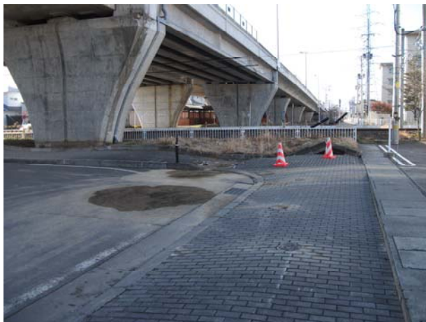
P5～P4（下り線）周辺歩道部沈下