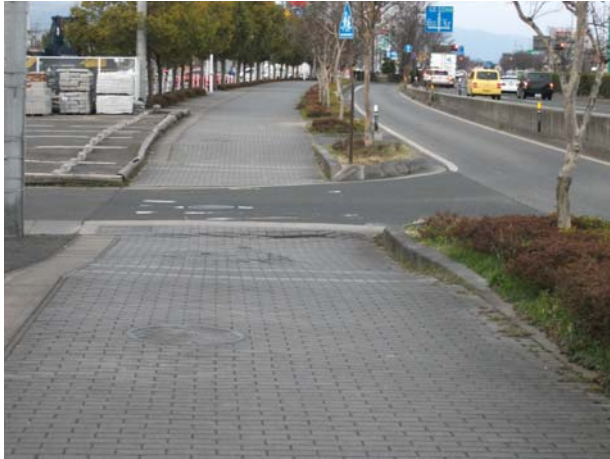
A2（下り線）付近 東側歩道沈下・波打ち