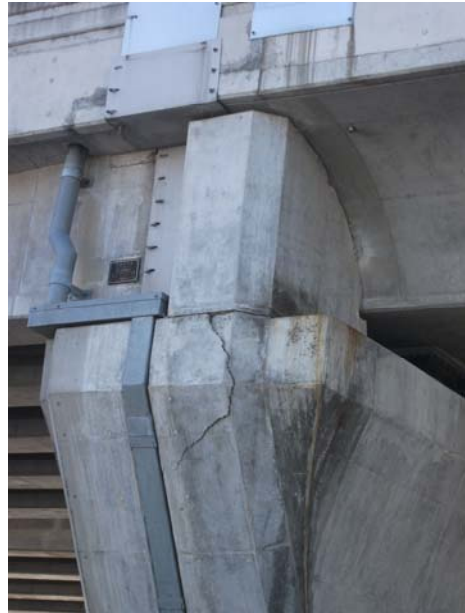
P4（下り線）台座 Co 損傷・クラック