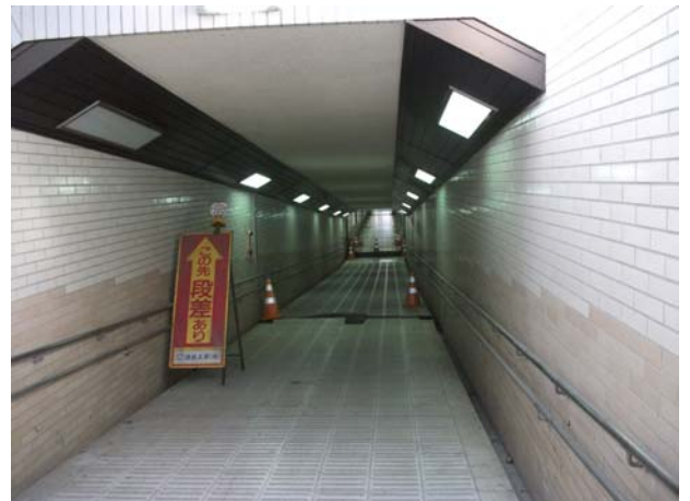
由添地下歩道（福島側斜路から米沢側を望む）