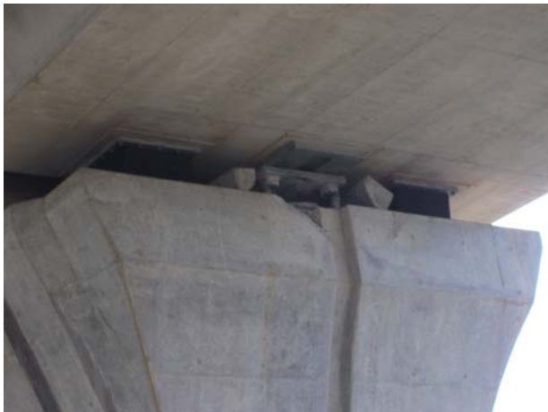
P9（下り線）変位制限装置周囲・台座 Co 破損