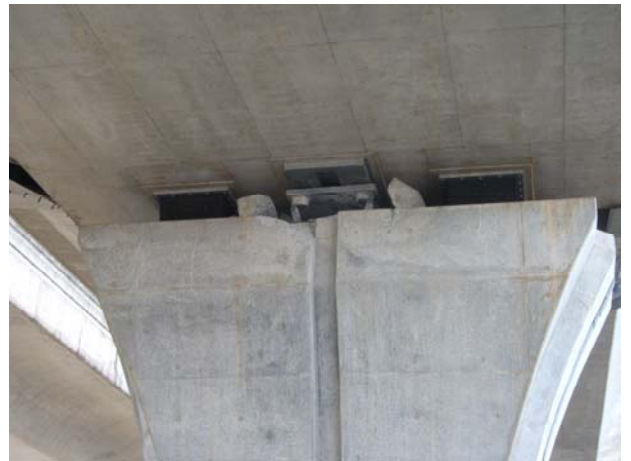
P9（下り線）変位制限構造浮き Co 除去確認