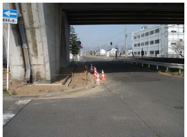
P4（上り線）周り排水溝復旧と市道沈下状況