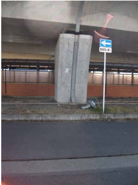
P2（下り線）排水装置落下