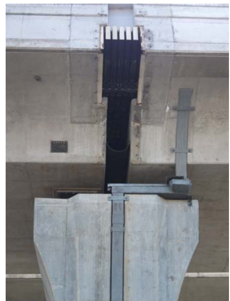
P9（下り線）伸縮装置カバープレート撤去