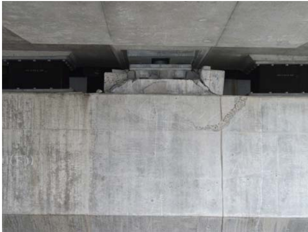
A1（下り線）変位制限構造 Co 破損・落下