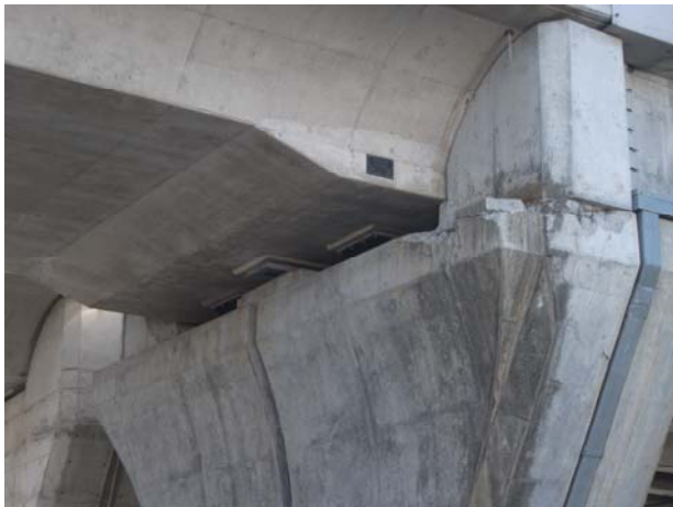
P5（下り線）台座浮き Co 除去確認