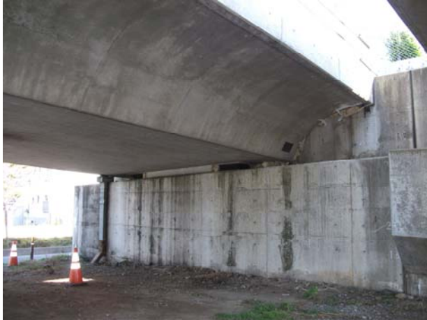
A1（上り線）伸縮継手損傷（本震時アンカーボルト切断か大音発生・応急（防音）工事開始