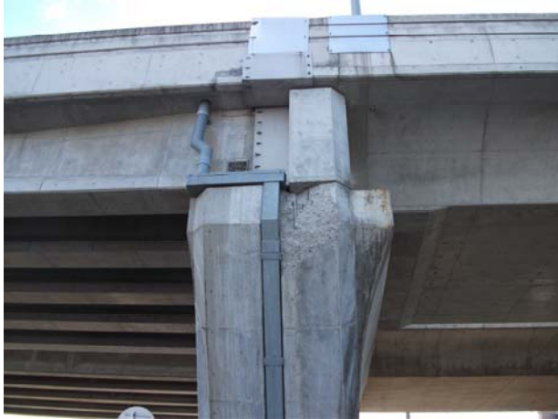
P4（下り線）台座浮き Co 除去確認