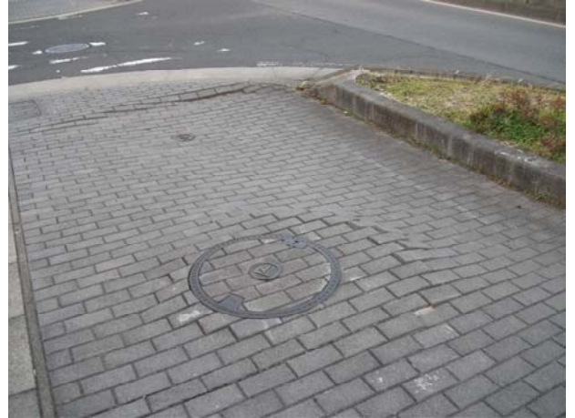
A2（下り線）付近 東側歩道沈下・波打ち