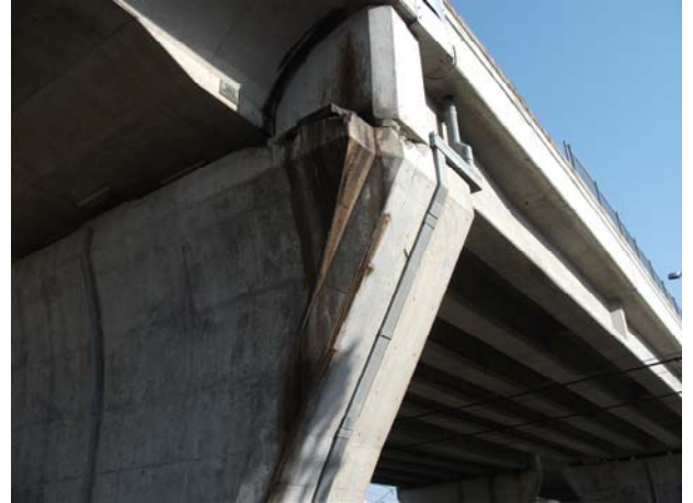
P5（下り線）変位制限構造台座 Co 破損・クラック・防食剤漏出