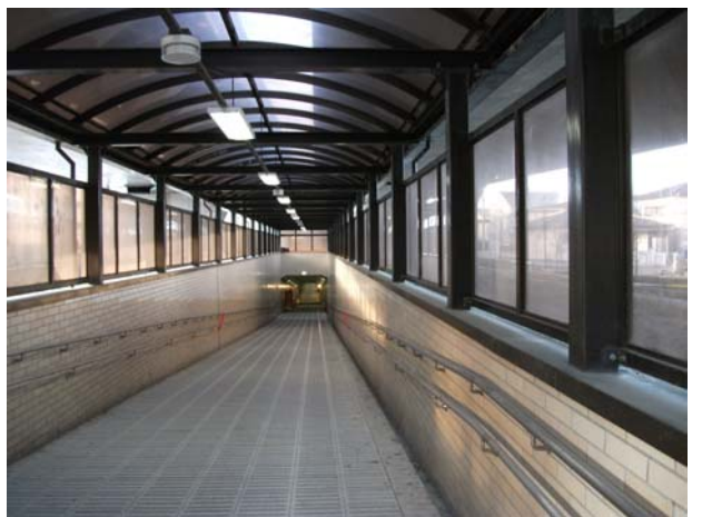
由添地下歩道復旧確認