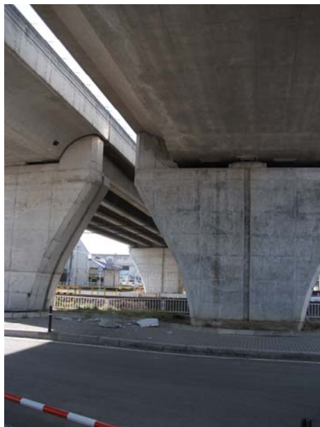
P5（下り線）変位制限構造破損 下：崩壊 Co 落下