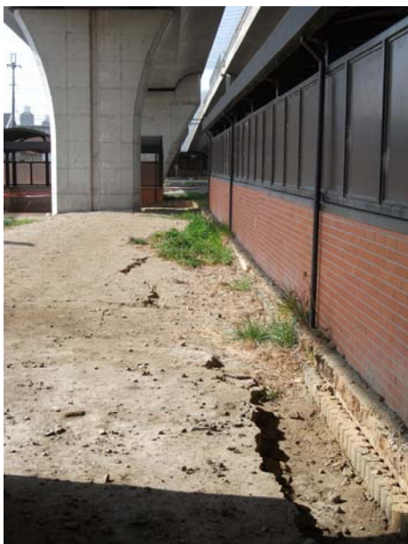
P6（上り線）付近地割れ状況