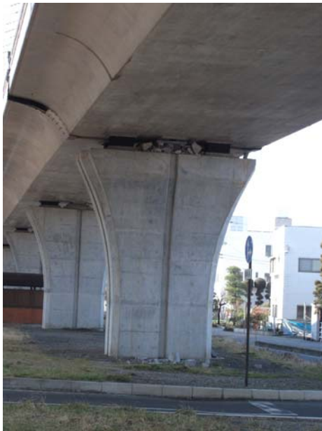
P9（下り線）変位制限構造 Co 損傷