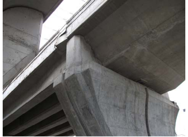
P5（下り線）変位制限構造 Co 破損・ 壁高欄継手板損傷