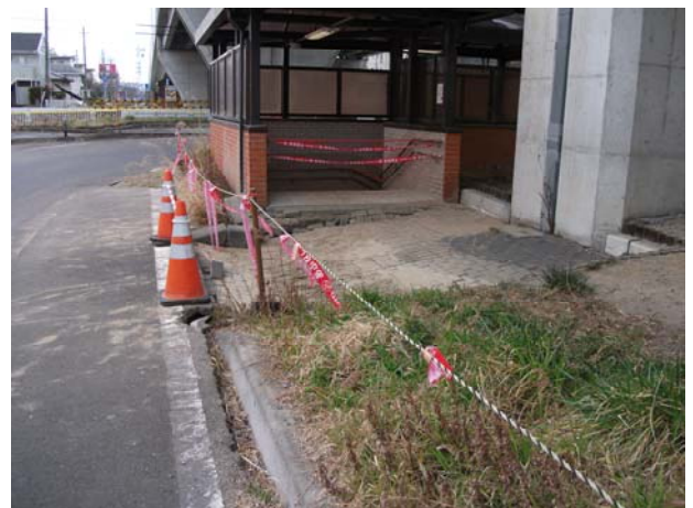
由添地下歩道北側中間出入口（東側） 沈下状況