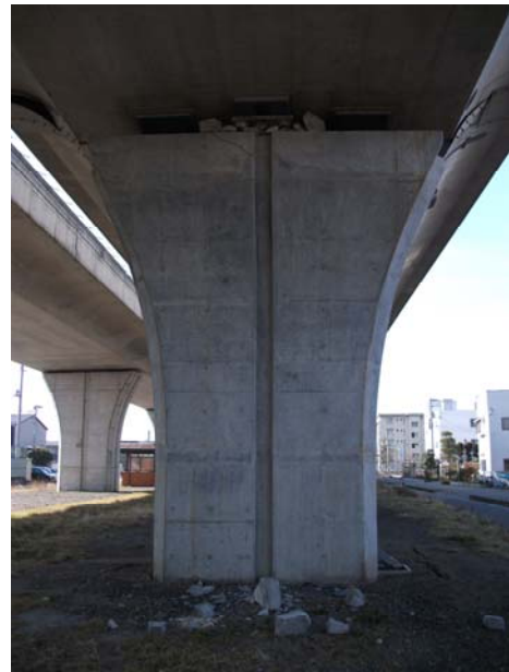
P9（下り線）変位制限構造周辺 Co 破損・崩落