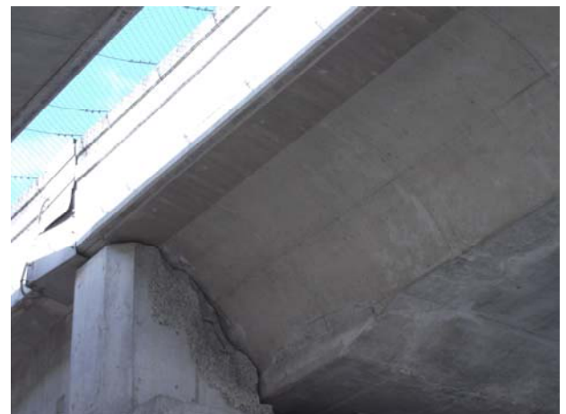
P5（下り線）壁高欄継手板損傷 （米沢側から望む）